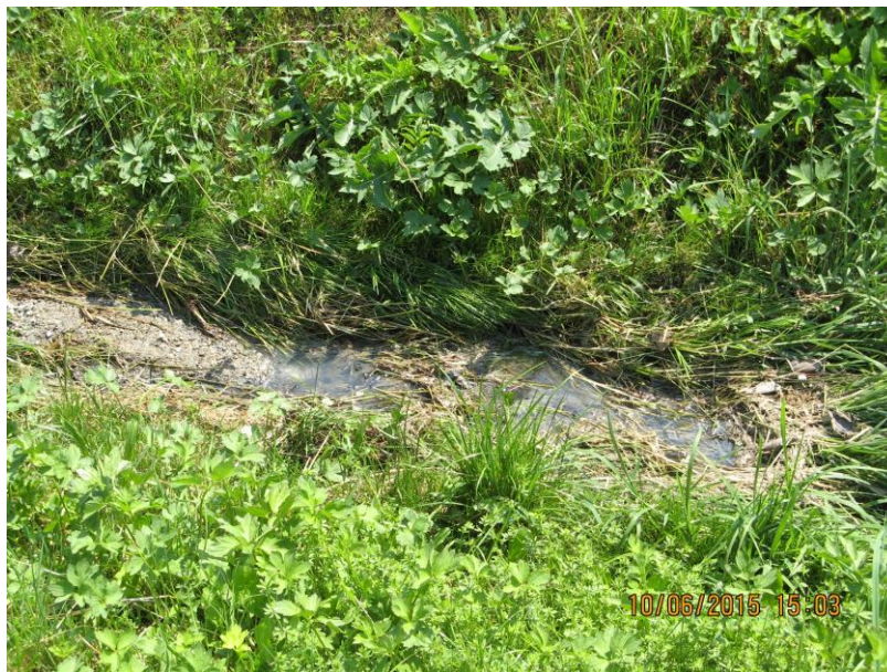
Slika 6: Iztekanje odpadne komunalne vode

Opravljal se je tudi nadzor nad neurejenimi zemljišči v strnjenih naseljih, nad urejenostjo odpadnih voda in nadzor nad uporabo vodovodov.