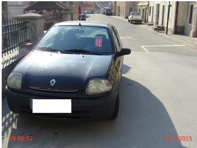
Slika 1: Nepravilno parkirano vozilo.

Do težav še vedno prihaja predvsem v samem trškem jedru Vitanja, pri križišču za Brezen. Opozorili bi na težavo pri Trgovini Mercator, kjer zaradi ureditve prometnega režima v enosmerni promet, prihaja do zastojev zaradi dostave v samo trgovino. Pri tem dostavna vozila onemogočijo promet po enosmerni cesti in posledično, se osebna vozila obračajo in vključujejo v promet na glavno cesto v neskladju s postavljeno signalizacijo.