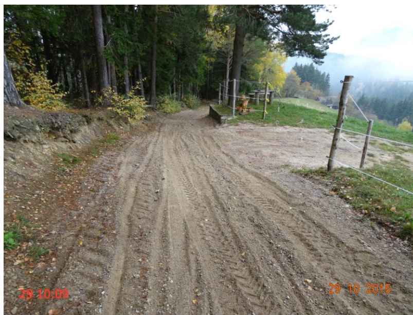
Slika 2: Poškodbe cestišča ob spravilu lesa.

Nadzirali smo posege na cesti oziroma njenem varovalnem pasu, kjer opažamo, da so ljudje vedno bolj osveščeni in si v večini primerov predhodno pridobijo ustrezno soglasje. Problem ostaja predvsem tam, kjer kategorizirana občinska cesta še vedno poteka po zemljiščih v zasebni lasti.