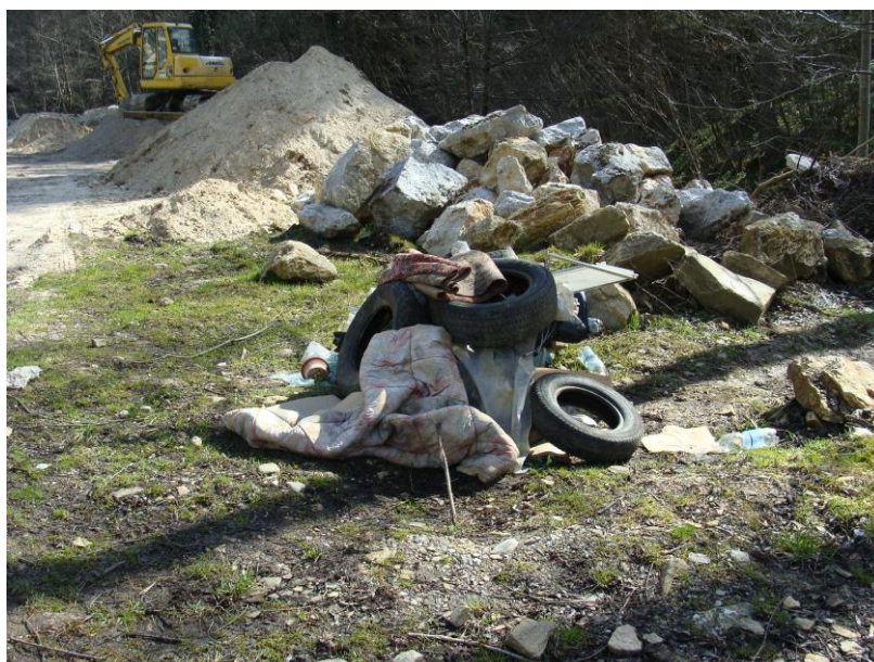
Slika 5: Odpadki odvrženi v naravnem okolju.

Ker je skrb za varstvo okolja eno od bistvenih postavk v zagotavljanju kakovosti javnega prostora ter kakovosti življenja občanov, smo v preteklem obdobju velik delež časa namenili vključevanju gospodinjstev v organiziran odvoz odpadkov, kar sedaj nadaljujmo z nadzoroma nad pravilno ločenimi odpadki na izvoru. Z nadzorom nad pravilnim ravnanjem ter odlaganjem odpadkov se bo nadaljevalo tudi v prihodnje, z namenom, da se ugotovi, ali in v kolikšni meri uporabniki upoštevajo določila občinskih odlokov o zbiranju in prevozu komunalnih odpadkov. Z nadzorom bi želeli tudi prispevati k drugačnemu razmišljanju tistih, ki še vedno nepravilno odlagajo odpadke.