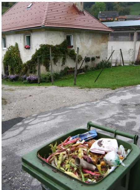
Slika 4: Nepravilno ravnanje z odpadki.

Prav tako smo sodelovali pri prometnih ureditvah, podajali smo predloge in pripombe na odvečno, pomanjkljivo ali neustrezno prometno signalizacijo, ki smo jo pri opravljanju vsakodnevnih nalog opazili.