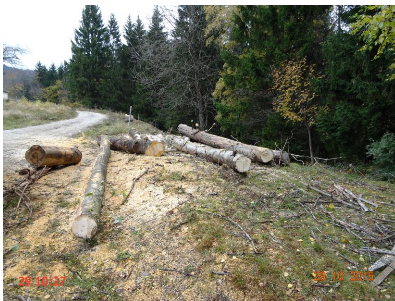
Slika 3: Varovalni pas - odložena hlovovina in onesnaženje ceste.