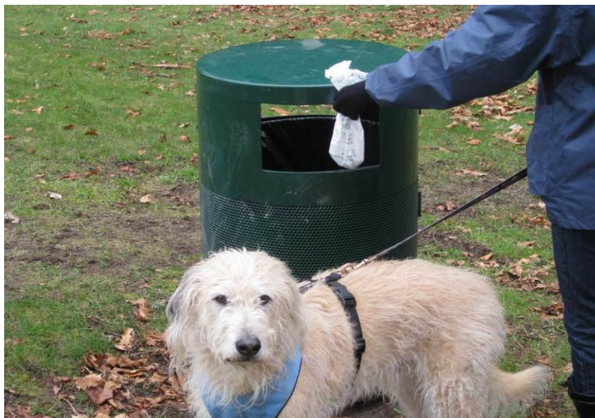
Slika 7: Pravilno ravnanje lastnika psa

Na območju Občine Vitanje se je tako kot v preteklem obdobju izvajal nadzor nad lastniki psov oziroma njihovo uporabo vrečk ter čistilnega pribor za pobiranje pasjih iztrebkov. Nadzor uporabe vrečk se je izvrševal po samem centru Vitanja in v okolici osnovne šole. Pri tem nadzoru je bilo ugotovljeno, da lastniki psov uporabljajo vrečke in se s tem stanje posledično izboljšuje.