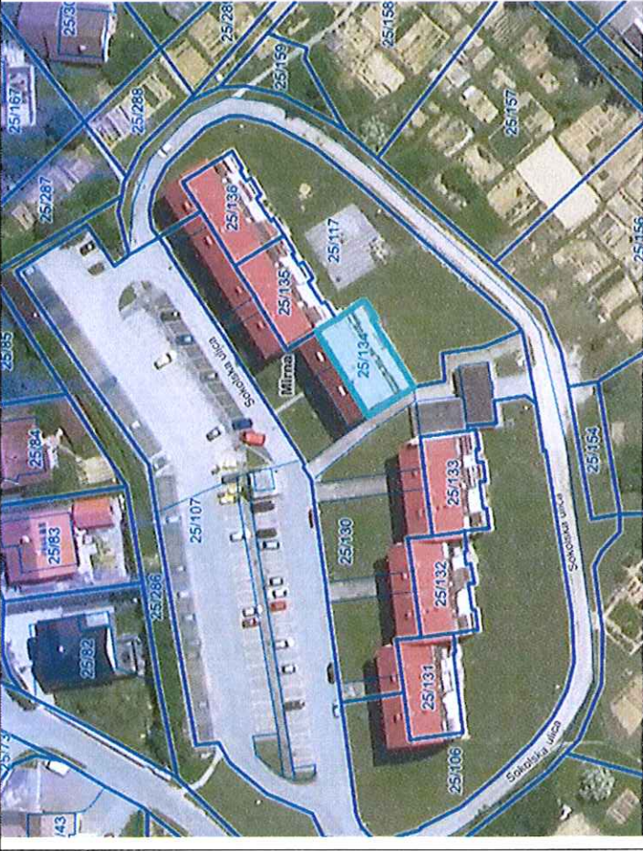
Parc. št. 25/134