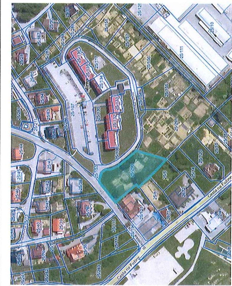
Parc. št. 25/290