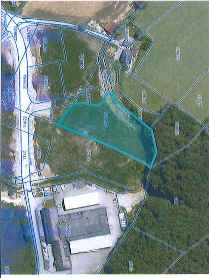
Parc. št. 2298/75