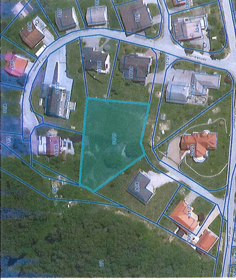
Parc. št. 31/20