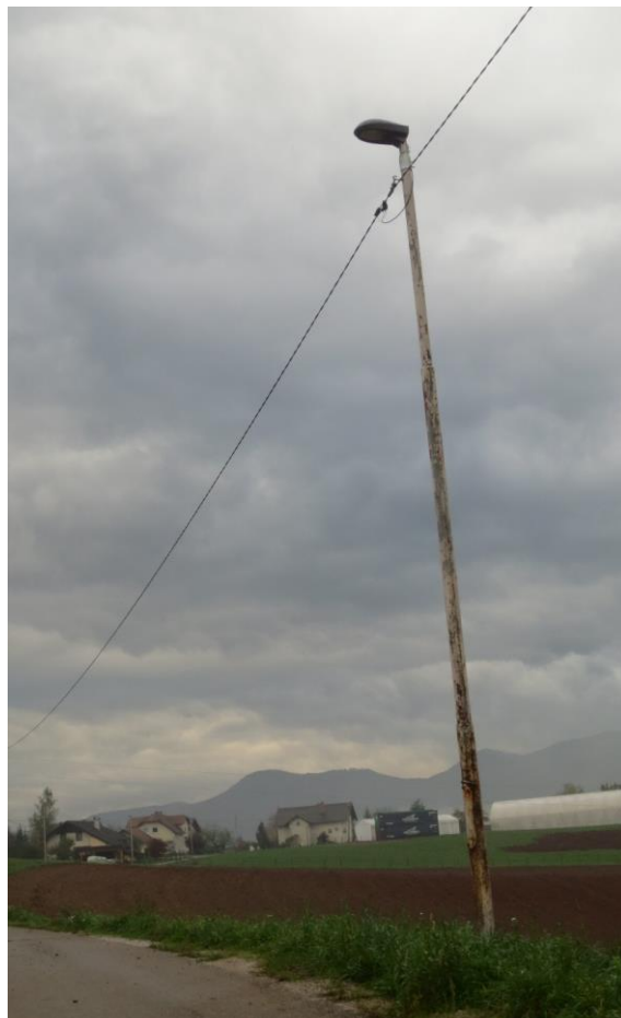
Slika 1: Prerjaven kandelaber v občini Grosuplje

Barvanje izvajamo v suhem vremenu pri stopinjah nad 5 stopinj.