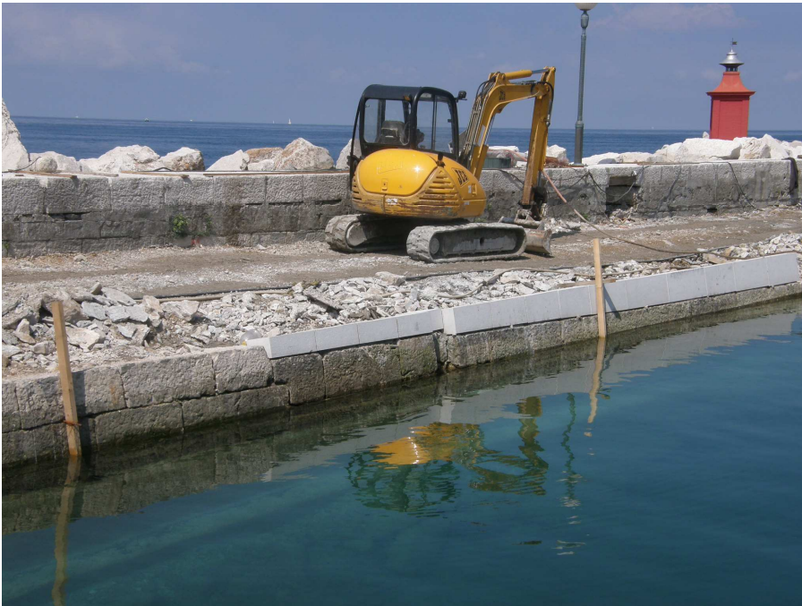
Kamniti zid, ki se je pred 100 leti posedel se je poravnal z novimi kamnitimi bloki.