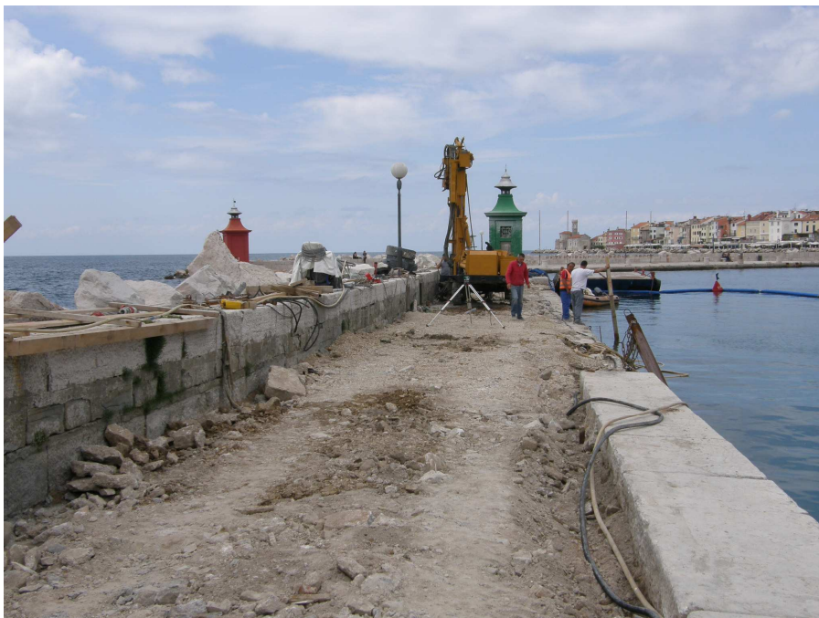
Odstranitev starega kamnitega tlaka

pomol dolžine 105m, širine 5m temeljenje: betonski piloti kom 27, globine do 20m