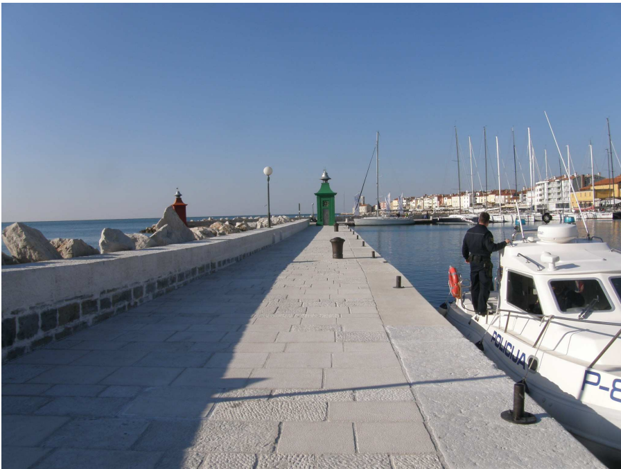
Saniran pomol na novo tlakovan pomol.