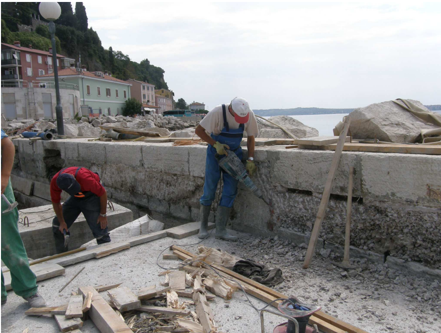
Sanirali smo parapetni zid in neustrezne betonske obloge.