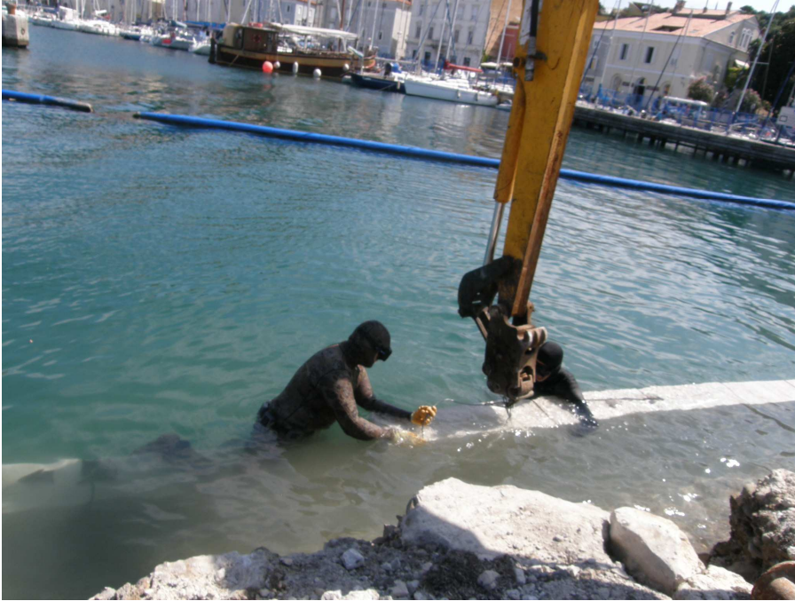
Podvodna betonska dela in zidanje se je vršilo s potapljači.