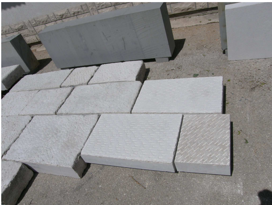
Pred izdelavo kamnitega tlaka so bili s strani ZVKD pregledani različni vzorci.