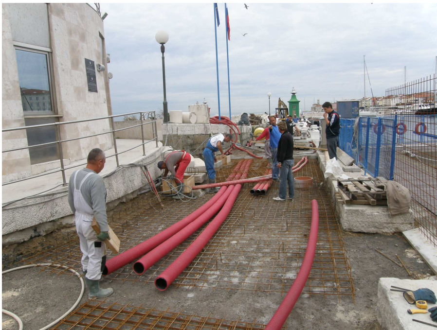
V pomolu so vgrajene infrastrukturne cevi z jaški in omaricami.