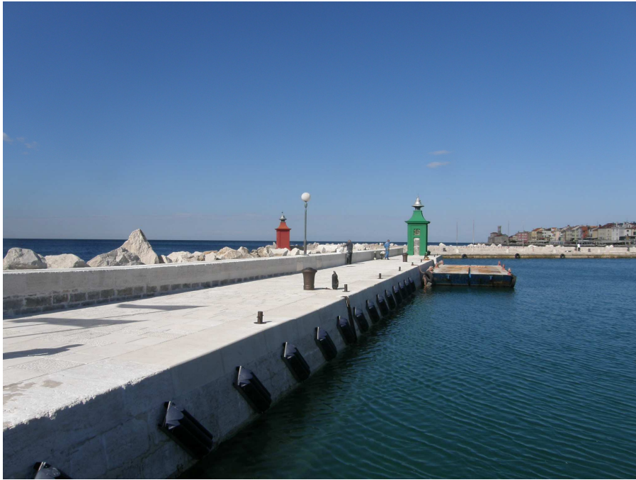
Ob pomolu so nameščene privezne bitve ter bokobrani za varno pristajanje ladij.