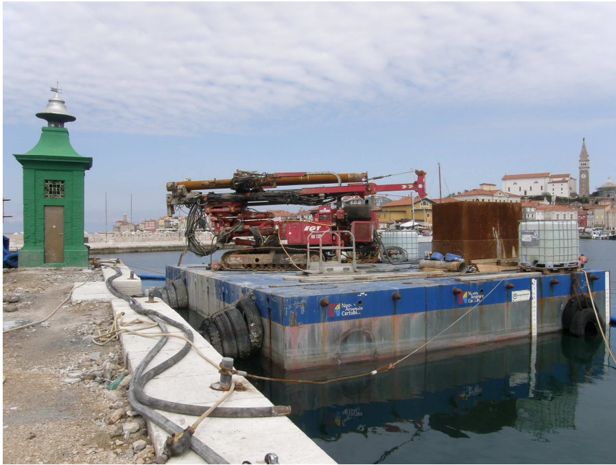
Večina del se je izvajala iz morske strani s pomočjo maone