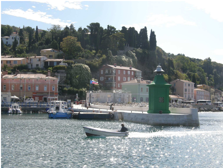
Pogled na pomol iz morske strani.