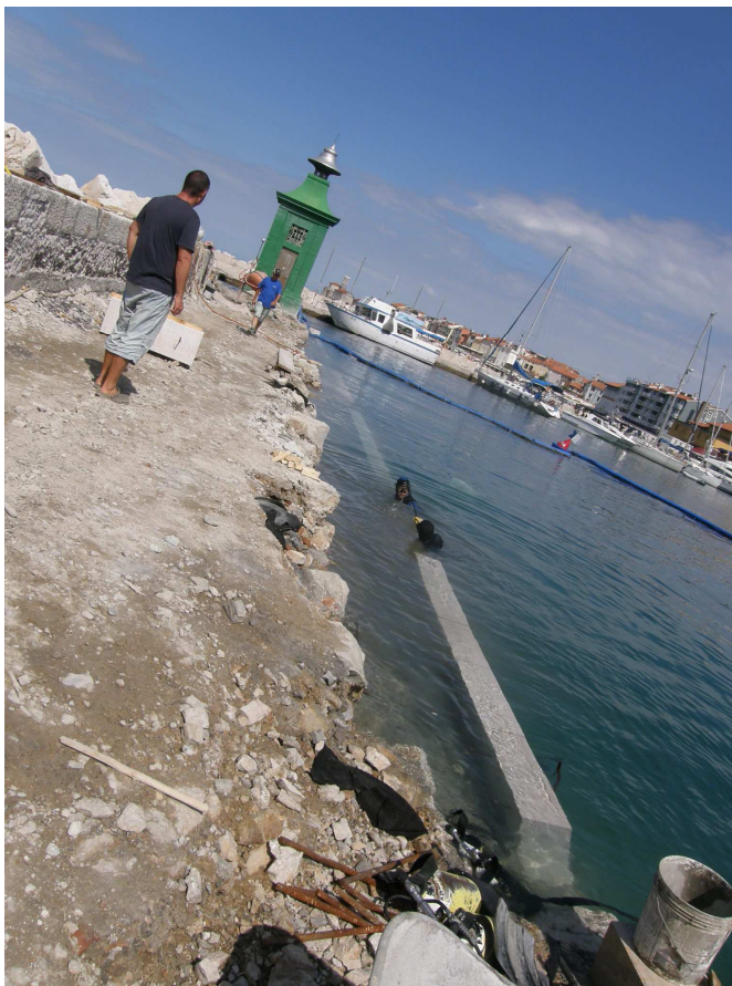
Po podvodnem betoniranju temelja sledi zidanje zidu v morju