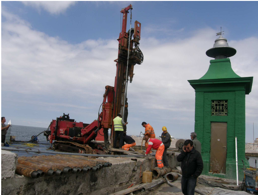
Zabijanje pilotov iz morske strani.