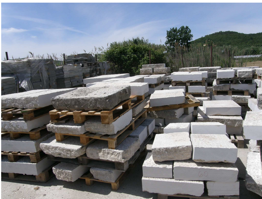
Spravilo tlaka za kasnejšo obdelavo in ponovno uporabo