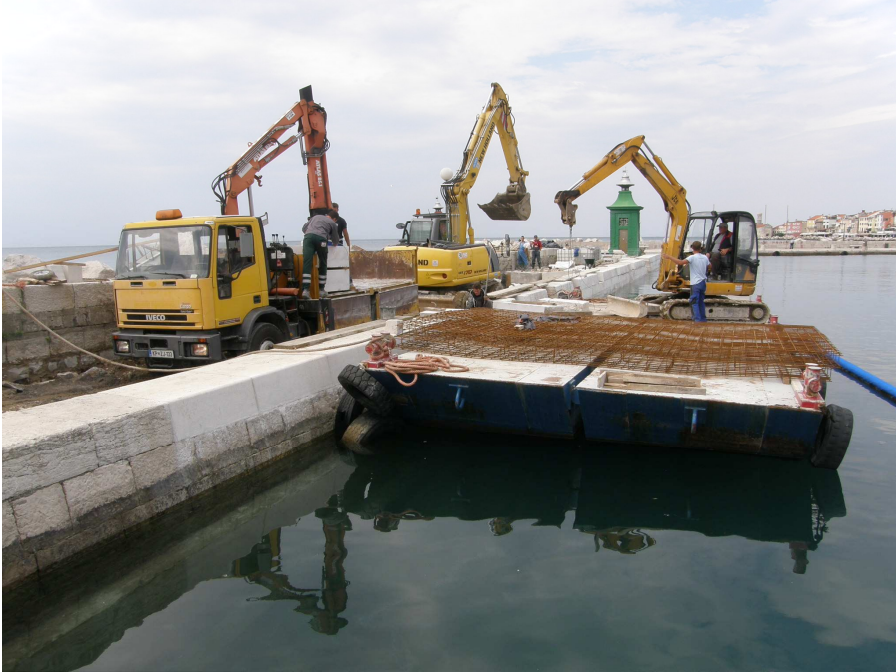
Vzporedno z betoniranjem temeljne grede se je izvajalo zidanje.