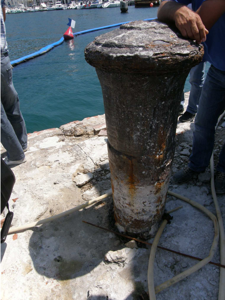
Sanirane so bile dotrajane bitve.