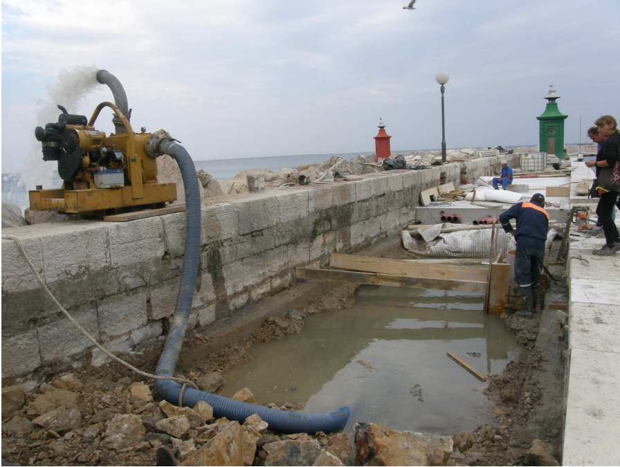
Dela na samem pomolu so potekala ob morskem delovanju in sprotnem črpanju vode.