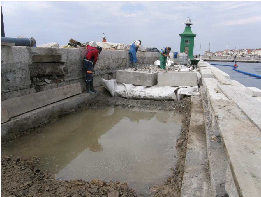
Težo pomola smo zmanjšali z plastjo penjenega stekla.