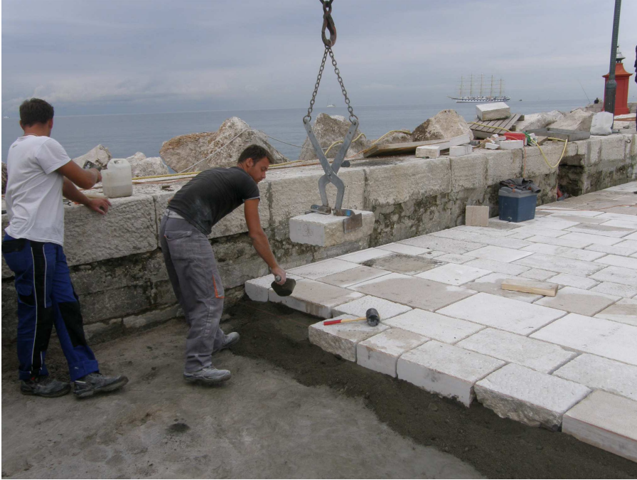
Kamniti talk predstavlja obdelan star kamen z dodatki novega kamna.