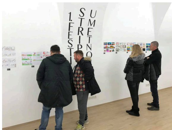
Slika 3: MIKK(S)TRIP Festival stripovske umetnosti