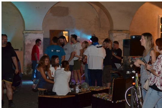
Slika 2: Jö poletje