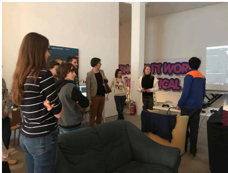
Slika 7: Delavnica v MIKKu