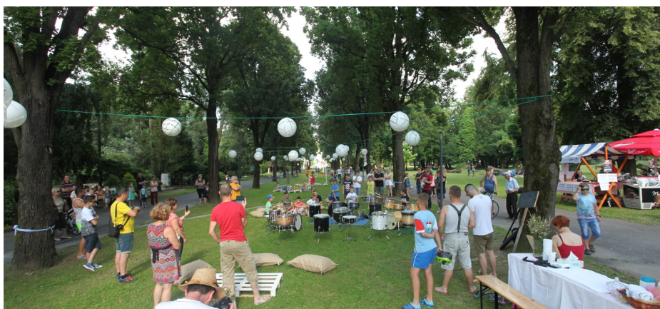
Slika 6: Igrivi park