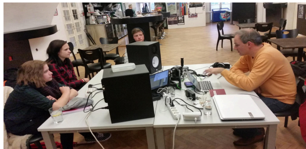
Slika 5: MIKK Lab