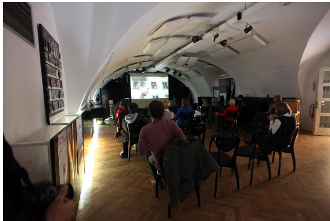
Slika 4: Predavanje v MIKKu