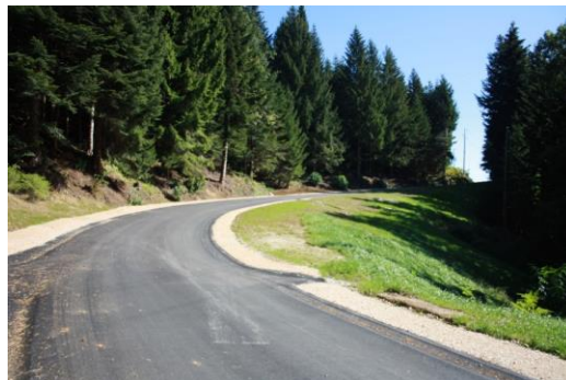
Slika 1: Moderniziran odsek ceste

Cesta predstavlja kvalitetno in prometno varno pridobitev za prebivalce občine, ki živijo na tem območju, kakor tudi za vse ostale uporabnike. Z dokončanjem II. faze v prihodnosti, pa bo sklenjena povezava s sosednjo občino, kar bo znižalo tudi stroške rednega vzdrževanja.