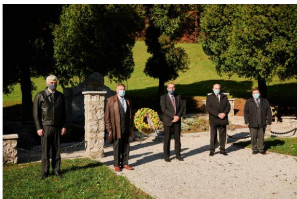
Slika 11: Položitev venca pri spomeniku 100 Frankolovskih žrtev

Pripravila: Sandra Vidmar Korošec, višja svetovalka za negospodarske dejavnosti