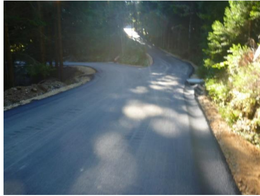
Sliki 5 in 6: Cesta med izvedbo ter po izvedbi modernizacije