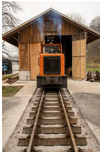
Slika 7: Ozkotirna dizelska lokomotiva VL8

Danes smo tako daleč, da bomo stoto obletnico izgradnje ozkotirnice obeležili kar s prihodom vlaka.