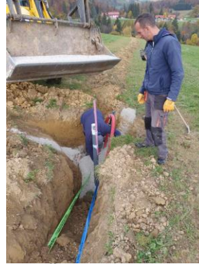
Sliki 3 in 4: Rekonstrukcija vodovoda v naselju Čretvež - Stranice