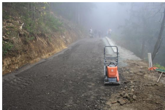
Slika 2: Dela v zaključni fazi

Z izvedbo AB podpornega zida je zagotovljena varna prevoznost ceste.