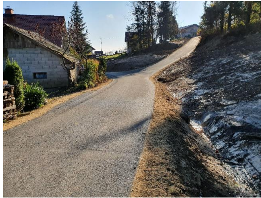
Slika 8: Modernizirana cesta Osrednek - Šarlah

Trenutna vrednost modernizacije skupaj znaša 83.552,55 €.