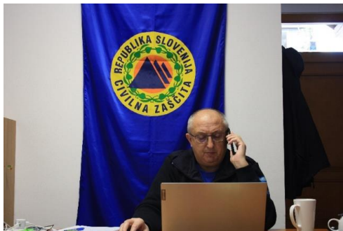
Sliki 13 in 14: Nova pisarna Štaba CZ Občine Zreče na Tržnici