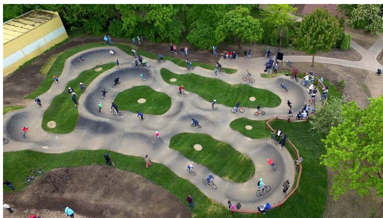
Slika 10: Pumptrack poligon

Pripravila: Sandra Vidmar Korošec, višja svetovalka za negospodarske dejavnosti