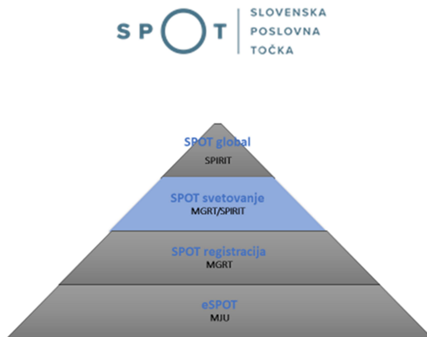
Slika 2-1: Sistem SPOT, Slovenska poslovna točka (SPOT točka)

RIC izvaja storitve na 2. in 3. ravni (postopke registracij in druge elektronske postopke za podjetja ter strokovna pomoč svetovalca). S storitvami pokriva predvsem območja občine Slovenska Bistrica, Makole, Poljčane in Oplotnica.