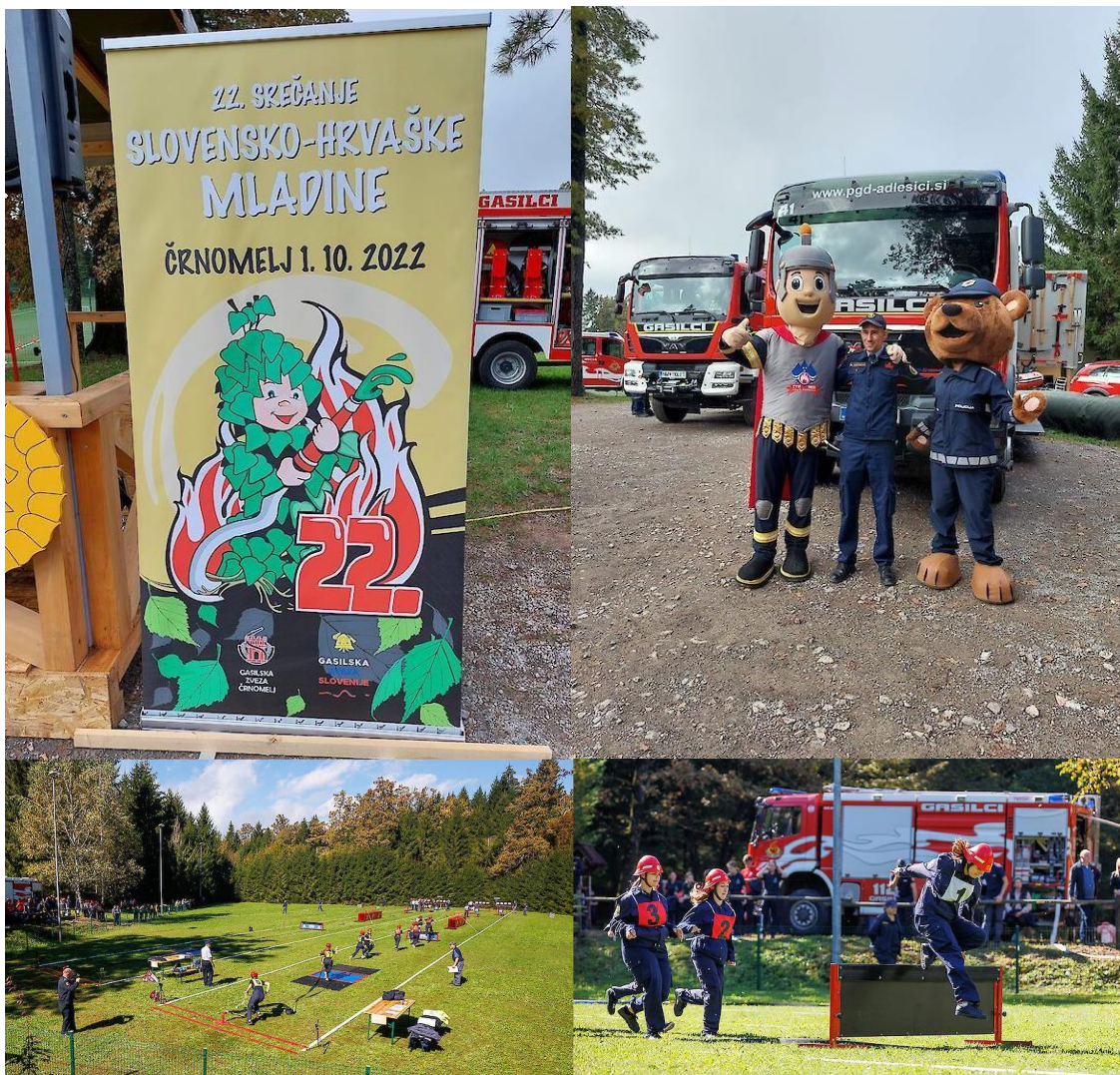
22. srečanje slovensko-hrvaške mladine