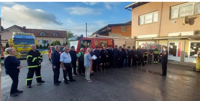
Podarjeno rabljeno vozilo GVC-16/20 PGD Vinica