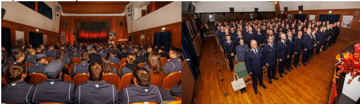
Svečanost ob podelitvi listin...