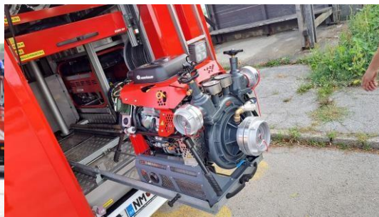
MB PGD Griblje