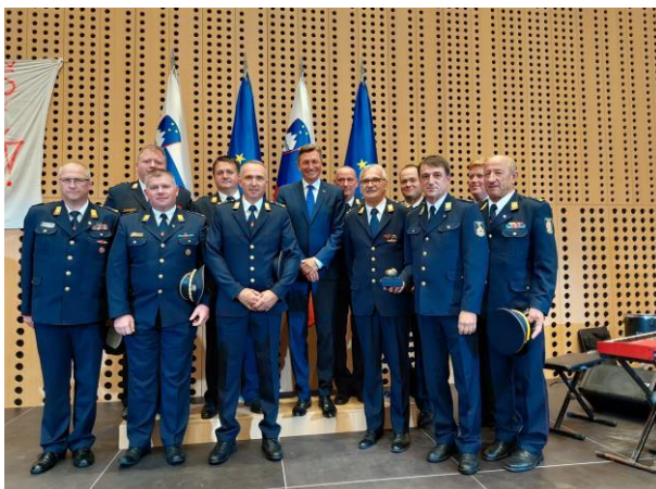
Sprejem pri predsedniku RS