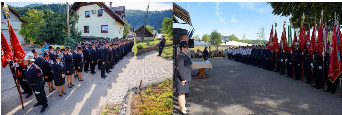
Svečanost v PGD Radenci

V letu 2022 je bilo v skladu s Pravili gasilske službe in gasilskim protokolom izvedenih šest obletnic 110 let PGD Dragatuš (za nazaj 2020), 90 let PGD Radenci, 70 let PGD Bojanci in PGD Butoraj, 50 let PGD Rožič Vrh in 40 let PGD Hrast-Perudina, ter prevzemi vozil ter tehnike in sicer v PGD Dragatuš GVC-16/25, PV-1, GČ-1 in PMB (v sklopu praznovanja 110 letnice), PGD Hrast – Perudina GVV-1 in MB (v sklopu praznovanja 40 letnice), PGD Bojanci prevzem MB (v sklopu praznovanja 70 letnice), PGD Radenci prevzem MB (v sklopu praznovanja 90 letnice) PGD Adlešiči GVC-16/25, PGD Stari trg ob Kolpi GVC-16/25 in PGD Vinica GVC-16/25.