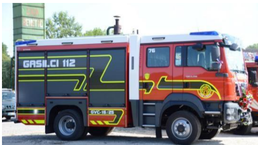
Vozilo GVC-16/25 PGD Vinica