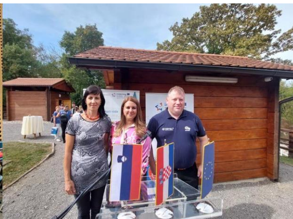
Dan evropskega sodelovanja mladih Evrope

Inšpektorat za varstvo pred naravnimi in drugimi nesrečami je v letu 2022 opravil inšpekcijske nadzore v enotah II. kategorije in sicer v PGD Dragatuš in PGD Vinica, ugotovljeno je bilo, da enoti posedujejo potrebno gasilsko zaščitno opremo, imajo ustrezno število usposobljenih operativnih gasilcev kateri so zdravstveno pregledani. Skratka ni bilo zaznanih pomembnih napak.