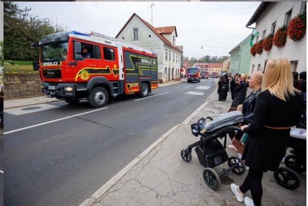
Svečani mimohod gasilcev