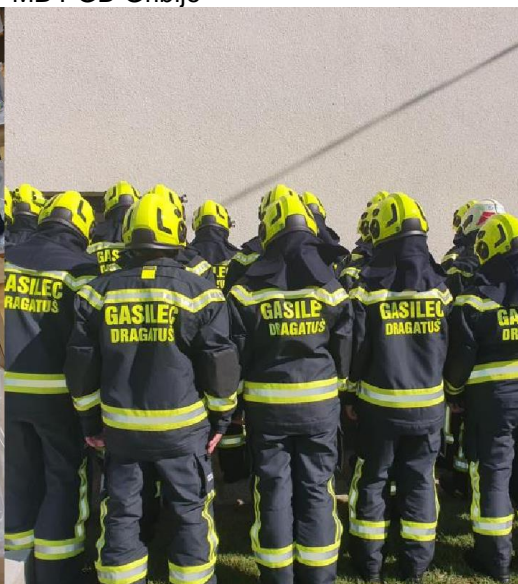
Osebna zaščitna oprema operativnega gasilca v GZ Črnomelj