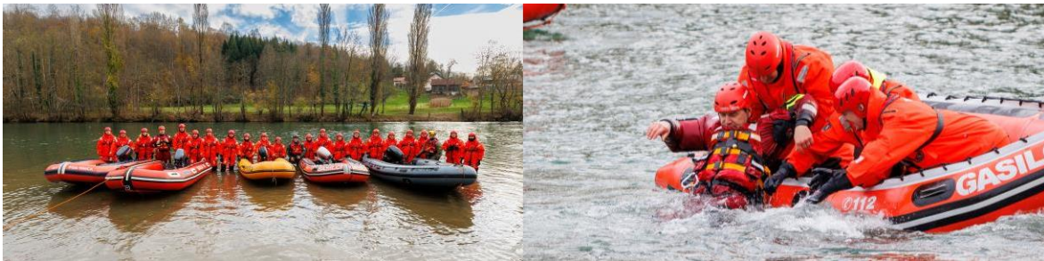
Usposabljanje reševanje na vodi