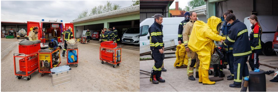
Tečaj operativni gasilec 2022