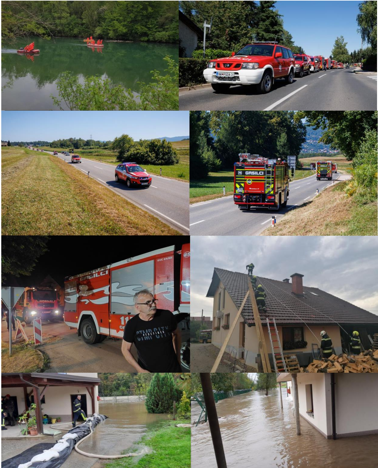
intervencije 2022, reševanje na vodi, odhod na Kras, prevoz pitne vode Poljanska dolina in neurje z močnim vetrom sektor Adlešiči, poplava Setje selo)