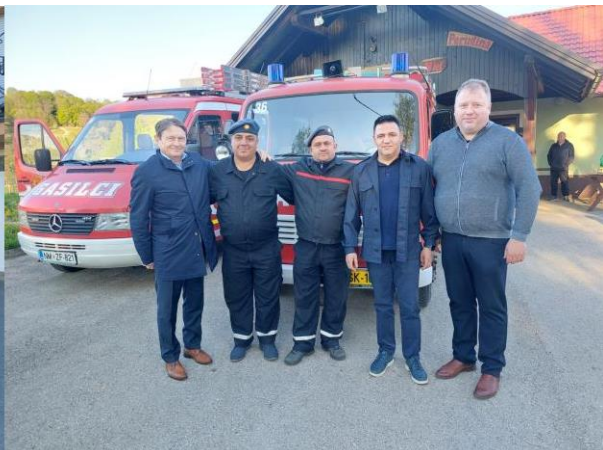
Podarjeno rabljeno vozilo GVV-1 PGD Hrast – Perudina