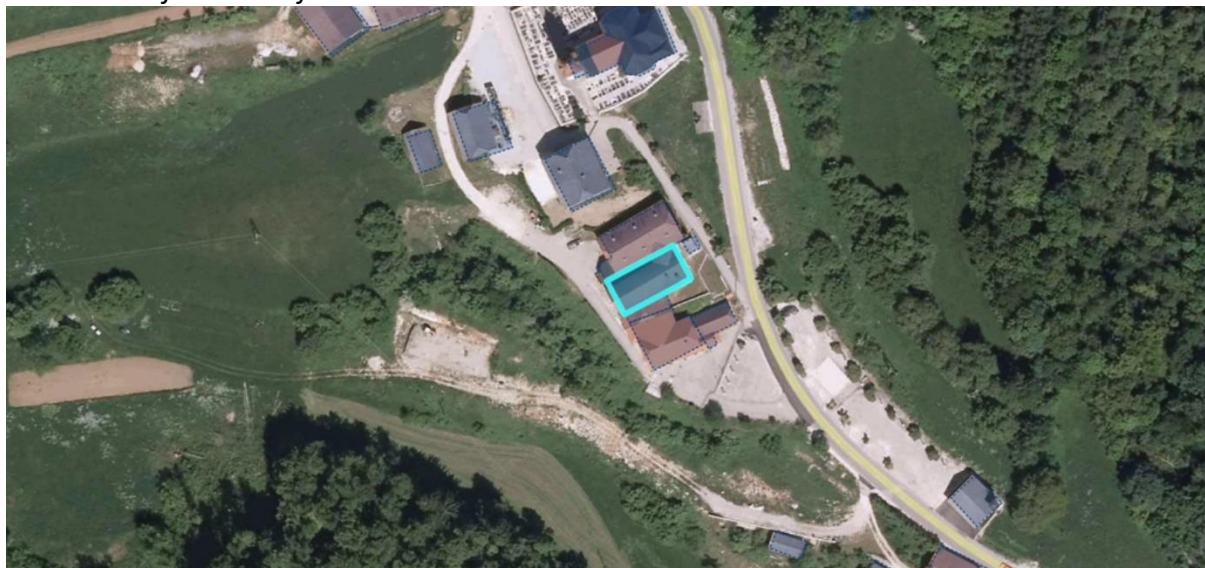
Slika: Lokacije investicije