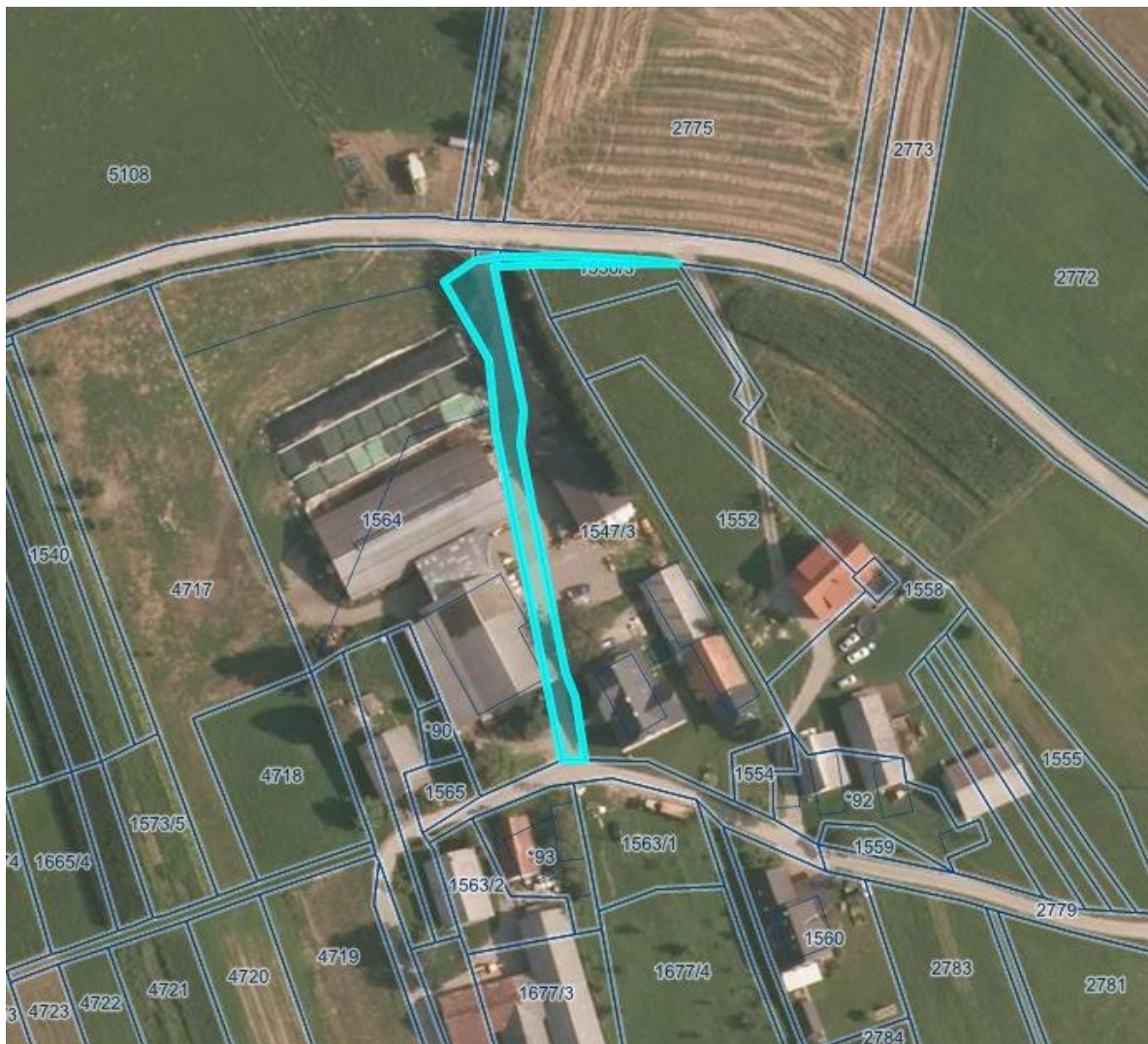
Priloga: Prikaz zemljišč