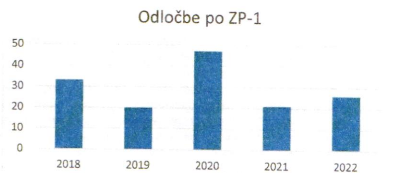
Preglednica 3: Odločbe po ZP-1