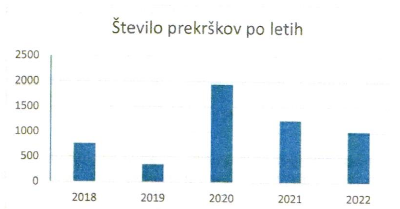
Preglednica 1: Število prekrškov po letih