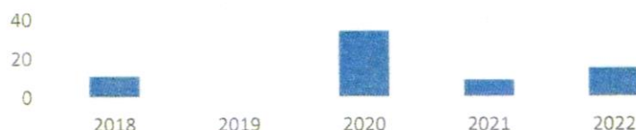
Preglednica 4: Zahteve za sodno varstvo