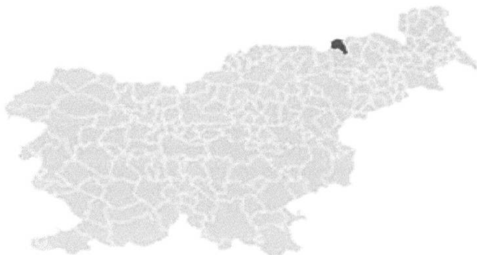
Slika 1: Občina Kungota v Sloveniji