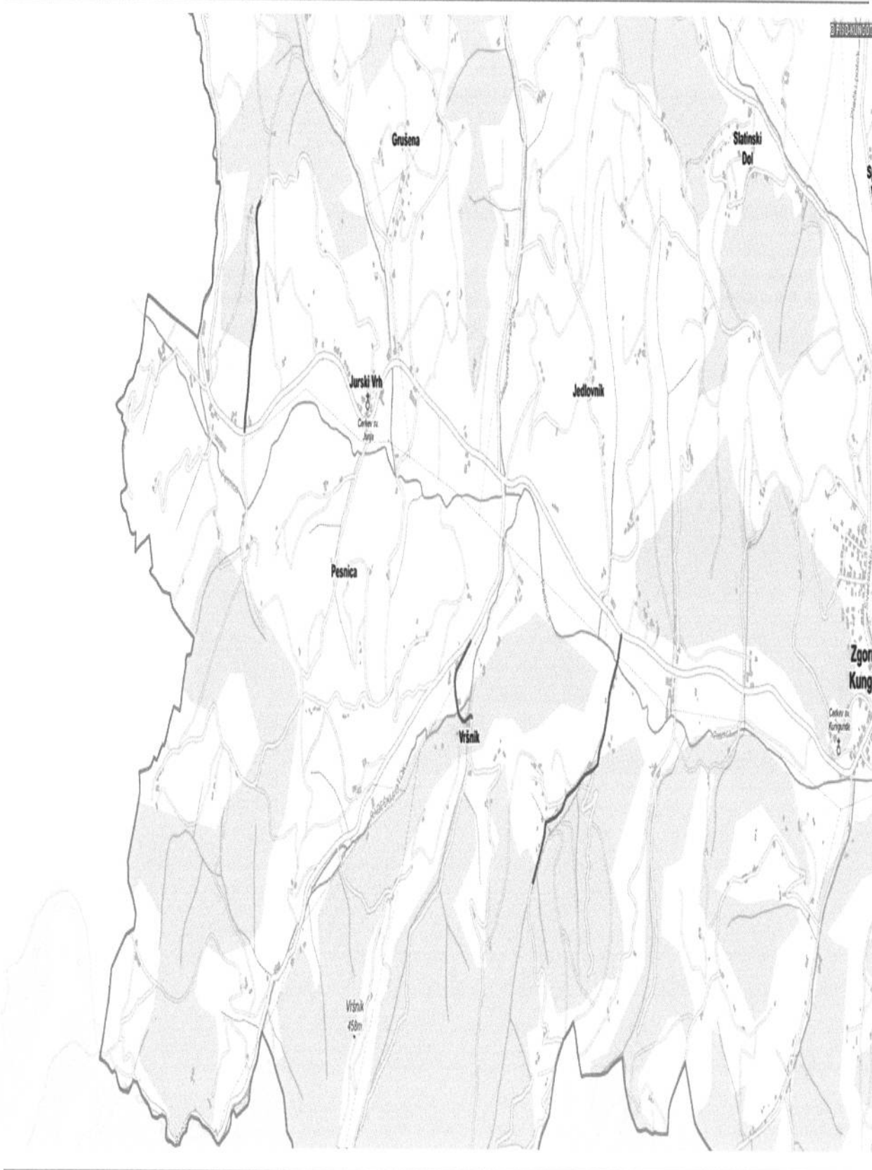
Slika 2: Označba cest, ki so planirane za obnovo (rdeča barva):