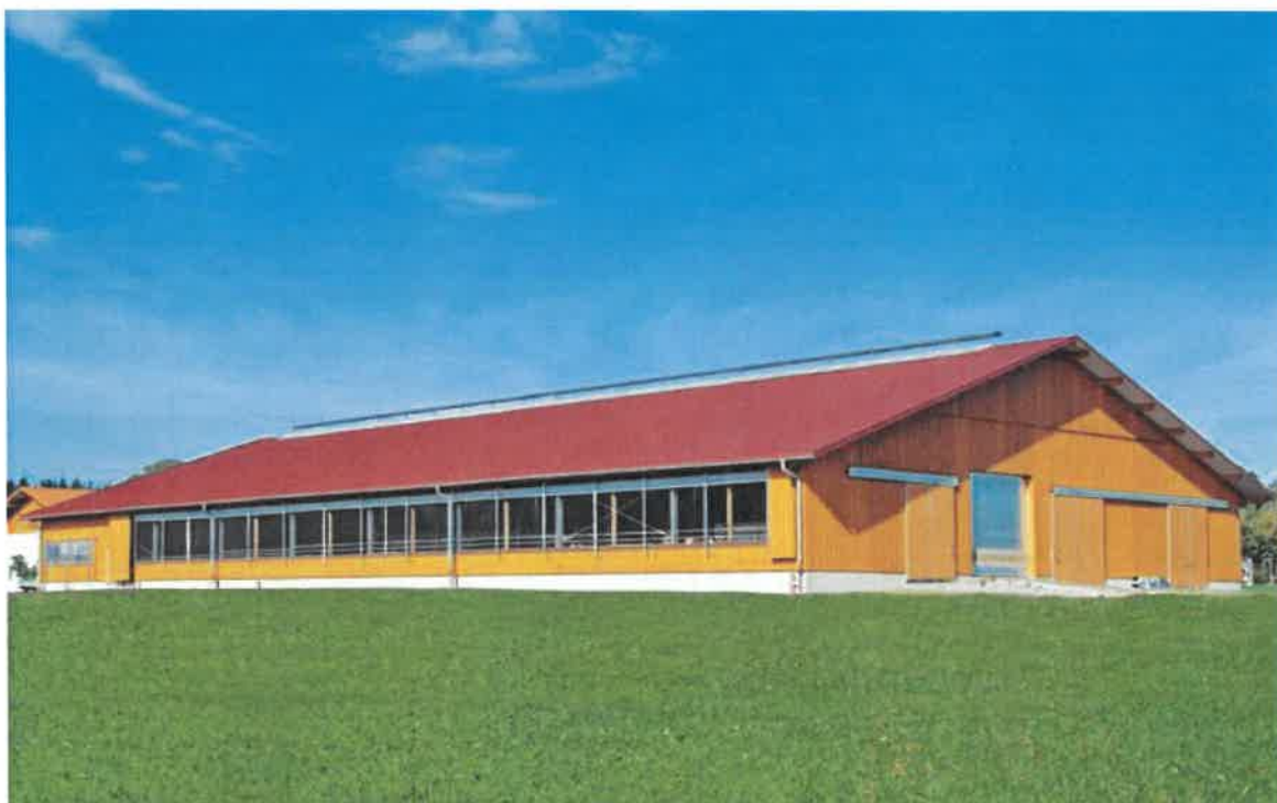
Prikaz izgleda nameravane novogradnje