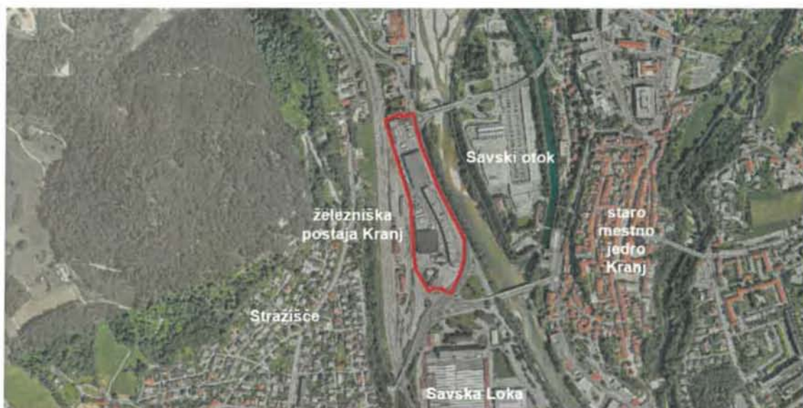
Prikaz območja OPPN na ortofoto posnetku

Območje EUP KR SA 4 se nahaja na zahodnem delu mesta Kranj in obsega površine železniške postaje Kranj s tirnimi napravami in objekti ter območje poslovno logistične cone med železniško infrastrukturo in Ljubljansko cesto. Območje OPPN obsega le vzhodni del območja KR SA 4, ki je v celoti pozidano in v naravi predstavlja preplet različnih dejavnosti in rab. V osrednjem delu se nahaja obstoječi poslovno skladiščni kompleks Kolodvor. Na južnem delu so tri manjše stavbe (stanovanjska stavba, gostinska stavba in poslovna stavba). Območje OPPN na severni strani meji na strnjeno pozidavo pretežno mešane rabe (gostinska, poslovna raba in stanovanjska raba), na vzhodni strani poteka državna cesta Kidričeva – Iskra (R2-412 Kranj), na južni strani križišče K1 'Železniška postaja' in na zahodni strani območje železniške postaje Kranj s pripadajočimi tiri in servisnim območjem v upravljanju Slovenskih železnic.