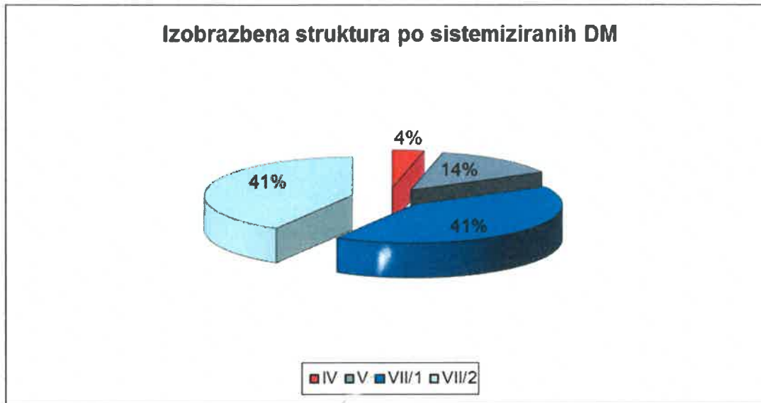
Graf št. 1: Izobrazbena struktura zaposlenih za nedoločen čas po sistemiziranih delovnih mestih v občinski upravi Občine Trbovlje