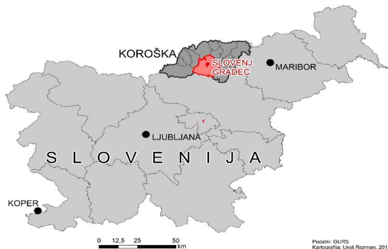
Slika 1: Mestna občina Slovenj Gradec v Sloveniji

Severno mejo občine tvorita občini Dravograd in Vuzenica, na severozahodu jo omejuje občina Ravne na Koroškem, na zahodu Črna na Koroškem, na jugozahodu Velenje, na jugovzhodu Mislinja in na vzhodu Ribnica na Pohorju. Strnjena naselja so razporejena po dolini, na pobočjih Pohorja in obrobni pogorjih pa so raztreseni manjši zaselki in samotne kmetije. Skoraj dve tretjini ozemlja pokrivajo gozdovi, kar daje pokrajini videz domačnosti, gostoljubnosti in mehkoobe.