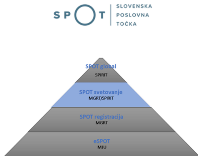
Slika 2-1: Sistem SPOT, Slovenska poslovna točka (SPOT točka)