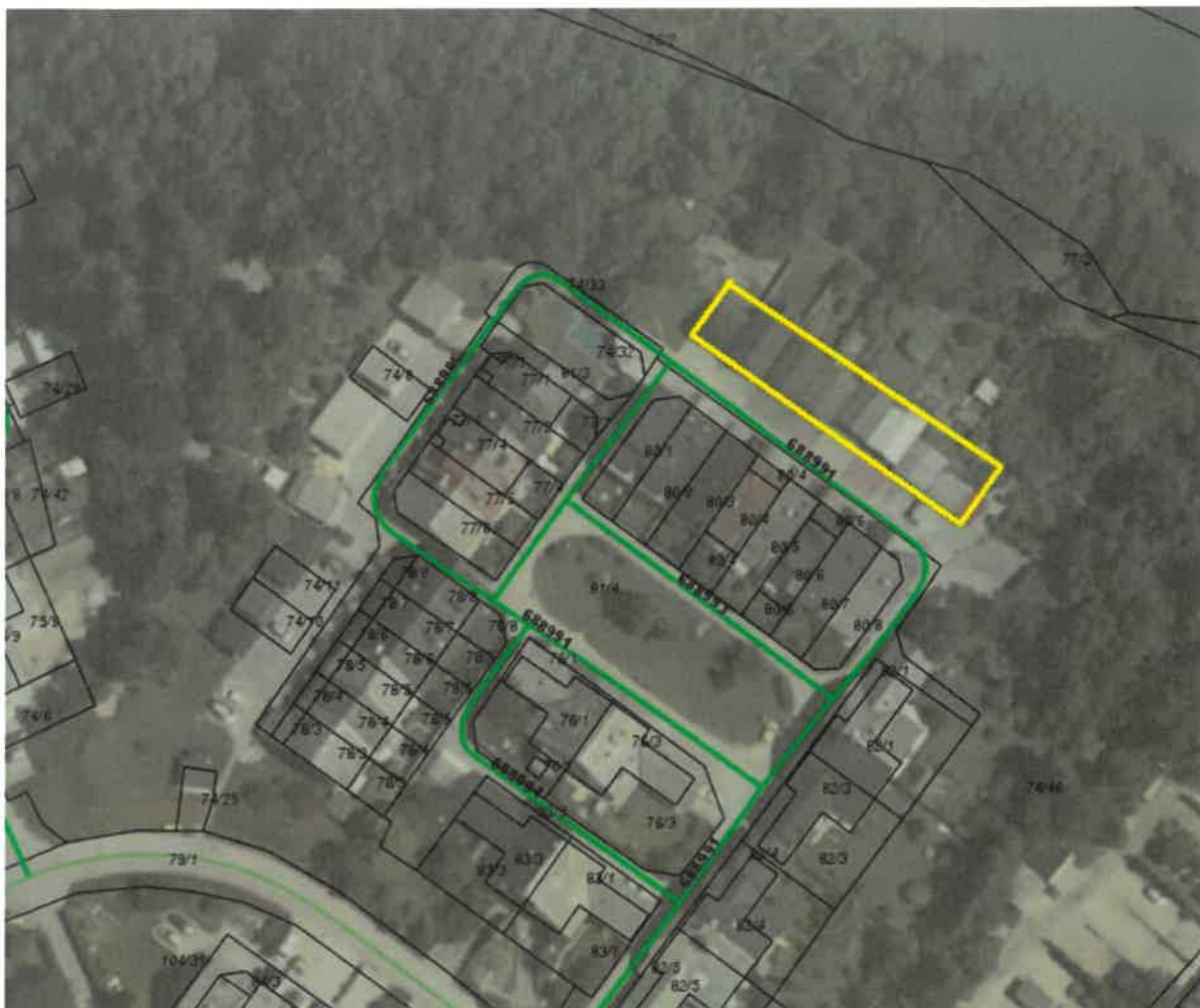
del zemljišča parc. št. 104/46 k.o. Drulovka