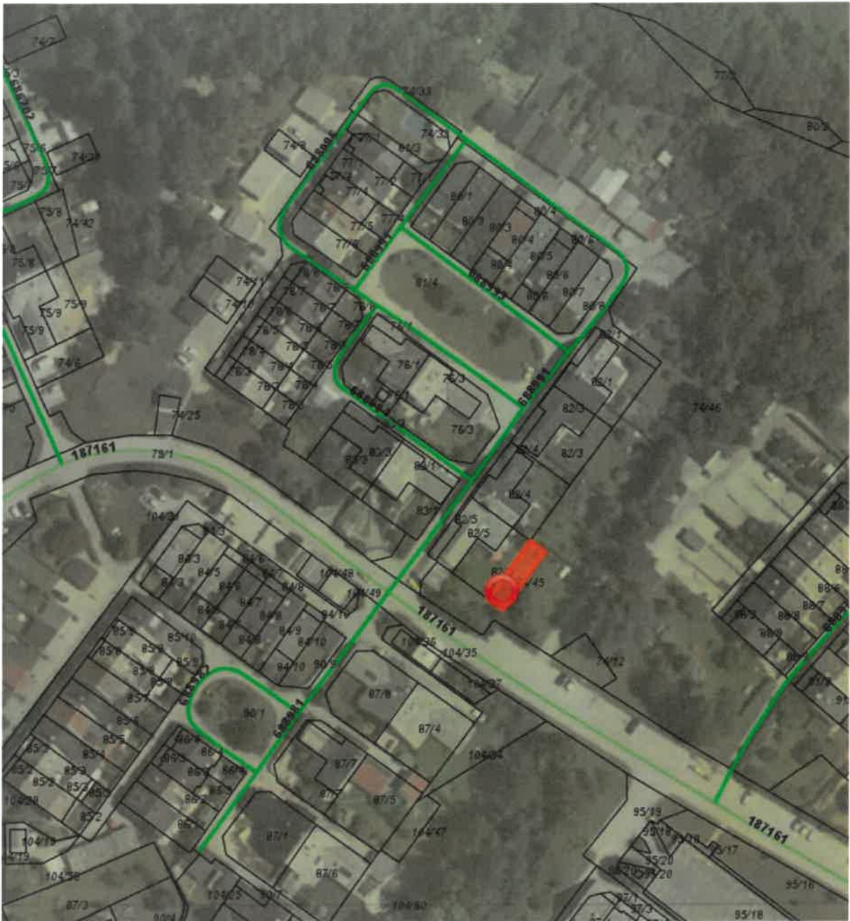
parc. št. 104/45 k.o. Drulovka