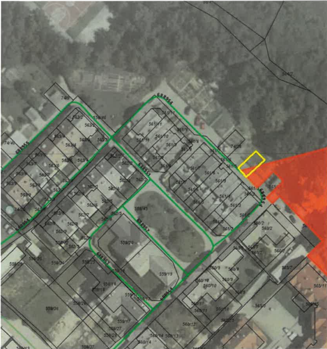
del zemljišča parc. št. 565/30 k.o. Breg ob Savi