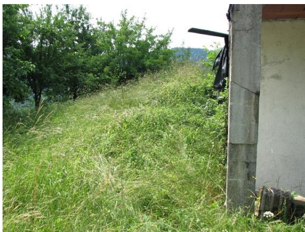
Slika 9: Neurejeno zemljišče

Glede na dejstvo, da občino obišče veliko turistov, smo se z opozarjanjem lastnikov glede neurejene okolice in objektov trudili, da ne izgubi slovesa lepo urejen občine.