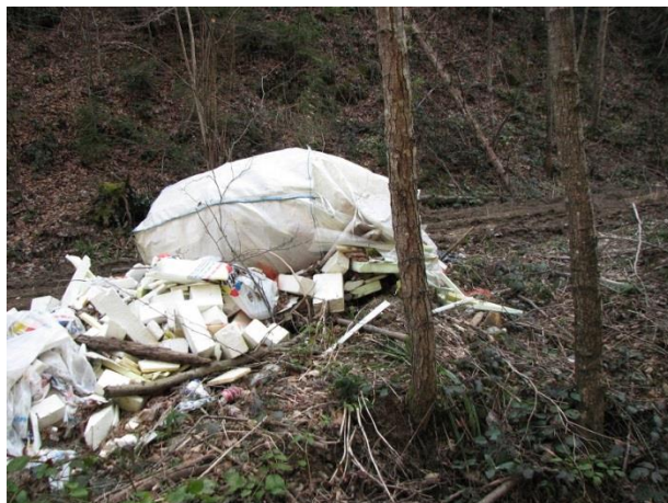
Slika 7: Odpadki v gozdu

Glede na dejstvo, da občino obišče veliko turistov, smo se z opozarjanjem lastnikov glede neurejene okolice in objektov trudili, da ne izgubi slovesa lepo urejen občine.