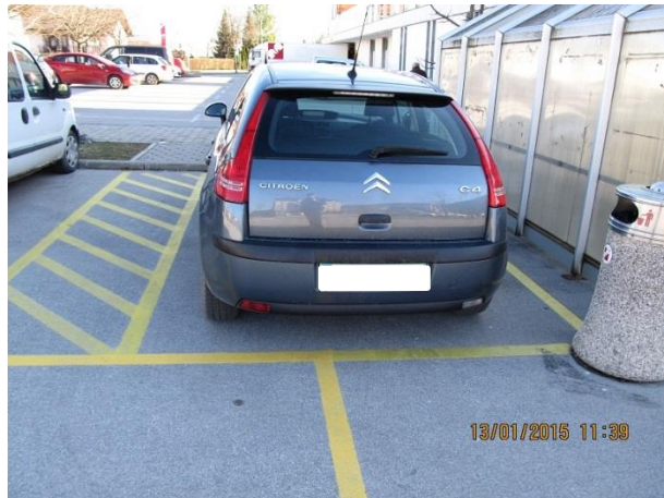
Slika 2: Nepravilno parkiranje