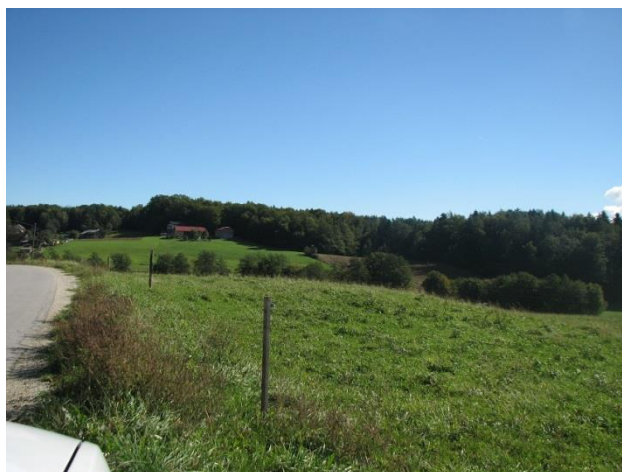
Slika 6: Električni pastir ob občinski cesti

V okviru varstva cest in udeležencev cestnega prometa smo pregledovali tudi razraščeno živih mej in drugega rastlinja v varovalnih pasovih občinskih cest. Prav tako smo sodelovali pri prometnih ureditvah, podajali smo predloge in pripombe na odvečno, pomanjkljivo ali neustrezno prometno signalizacijo, ki smo jo pri opravljanju vsakodnevnih nalog opazili.