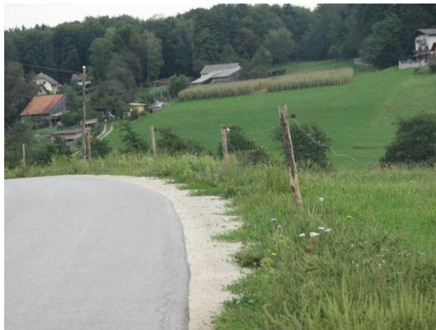
Slika 5: Električni pastir na bankini ob občinski cesti

Poleg onesnaženja cest velja omeniti tudi razne posege na cesti oziroma v njenem varovalnem pasu, od prekopov cest do raznih gradbenih posegov, oranja do cestišča, ter posledičnega povzročanjem ovir v cestnem prometu. V okviru izvajanja teh aktivnosti smo nadzirali tudi ustreznost pridobljenih upravnih dovoljenj in soglasij za izvajanje posegov.