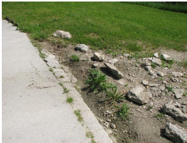
Slika 3: Poškodbe ob občinski cesti

V okviru varstva občinskih cest smo preko celega leta nadzirali onesnaženja cestišča, povzročena predvsem zaradi opravljanja kmetijskih del spomladi in jeseni ter povečane kapacitete opravljanja raznih zemeljskih del in izkopov v začetku gradenj.