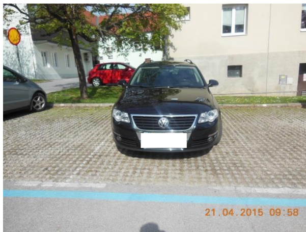
Slika 1: Nepravilno parkirano vozilo v modri coni

Glede na ugotovitve nadzora nad kršitvami predpisov s področja mirujočega prometa izstopa parkiranje v okolici Zdravstvenega doma Slovenske Konjice, v okolici Lambrechtovega doma in na Starem trgu. Največje število kršitev glede mirujočega prometa je v modri coni.