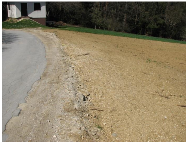
Slika 4: Oranje ob cesti

V okviru varstva občinskih cest smo preko celega leta nadzirali onesnaženja cestišča, povzročena predvsem zaradi opravljanja kmetijskih del spomladi in jeseni ter povečane kapacitete opravljanja raznih zemeljskih del in izkopov v začetku gradenj.