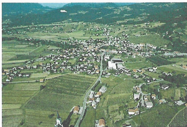
Slika 1: Oplotnica

Na občino Oplotnica mejijo občine Zreče, Slovenske Konjice in Slovenska Bistrica. Občina svojo turistično ponudbo povezuje tudi s sosednjimi občinami.