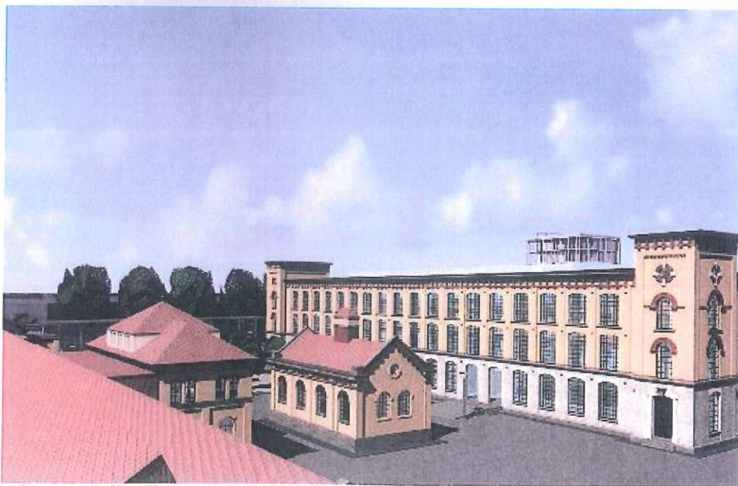
Primer revitalizacije oz. prenove kompleksa tekstilne tovarne v Stuttgartu, Nemčija