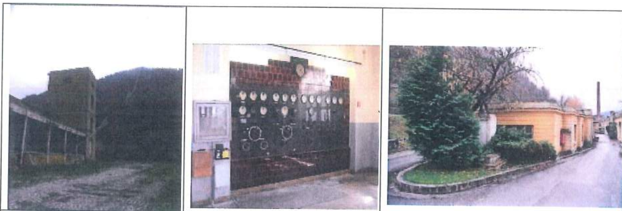
Vodni stolp, ostanki tirne infrastrukture, dimnik, HE 4 - komandna plošča, spomenik NOB, stara upravna stavba

Predlagamo, da se za premično tehnično opremo znotraj prenove območja uredi posamezni objekt, v katerem bi bilo mogoče urediti muzejsko zbirko tehnične dediščine BPT. Muzejski funkciji se lahko nameni novejši objekt delavnice tik ob hidroelektrarni 4, ki bi skupaj s HE 4 predstavljal zaključen muzejski sklop.