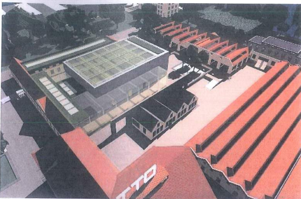
Primer revitalizacije oz. prenove kompleksa tekstilne tovarne v Stuttgartu, Nemčija

Arhitekt: Prof. Ing. Artur Mandler, Grafični prikaz: Wettbewerb HOS Areal, Stuttgart-Wendlingen