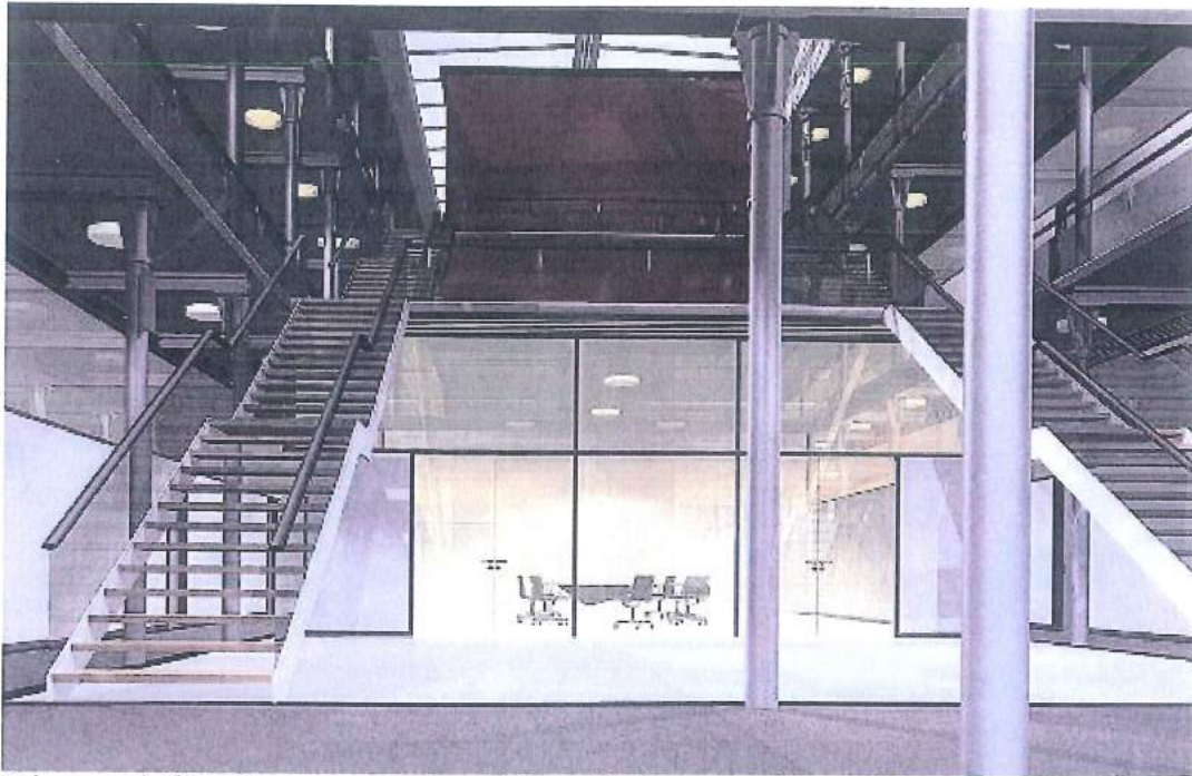
Primer revitalizacije oz. prenove kompleksa tekstilne tovarne v Stuttgartu, Nemčija (vidni ohranjeni in ustrezno prezentirani litoželezni stebri enakega oblikovanja kot v BPT)