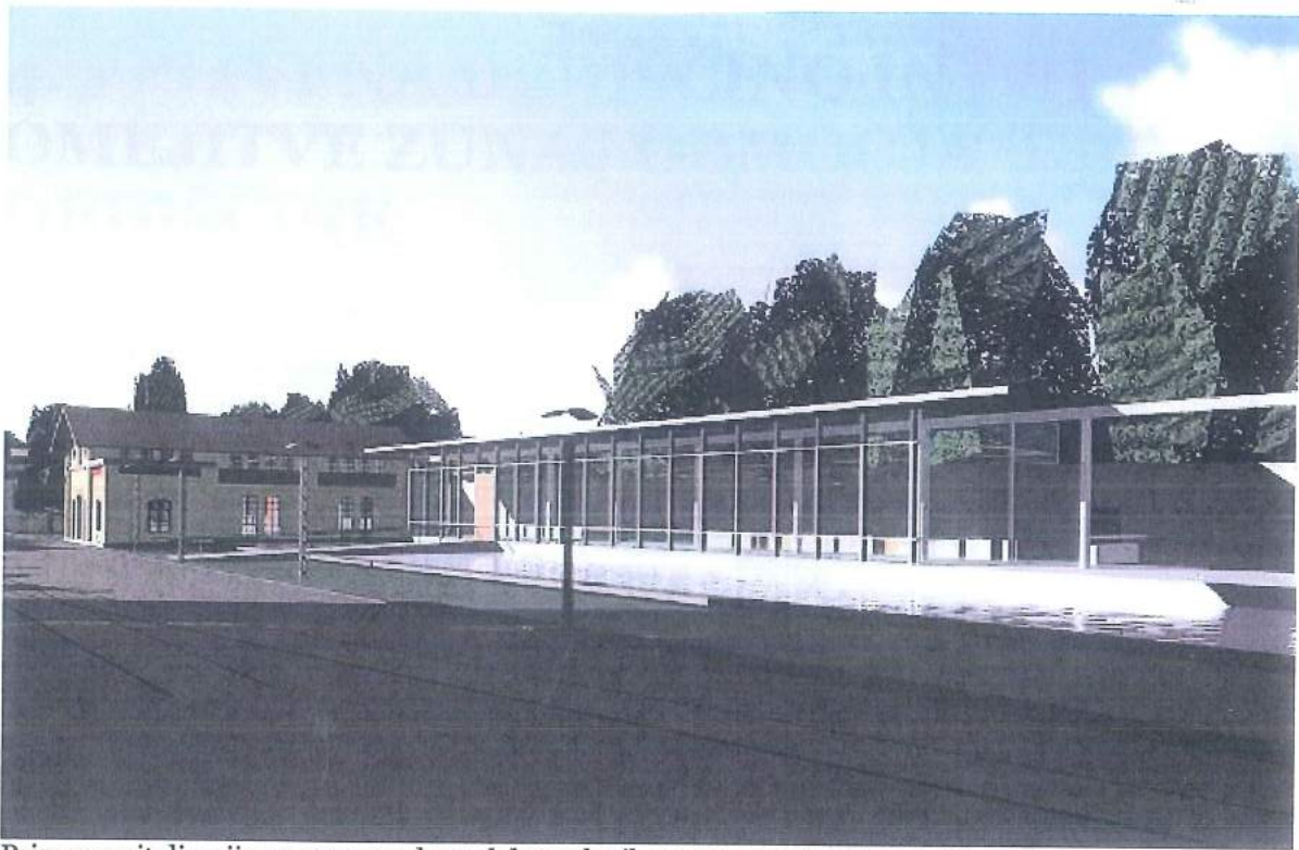
Primer revitalizacije oz. prenove kompleksa tekstilne tovarne v Stuttgartu, Nemčija