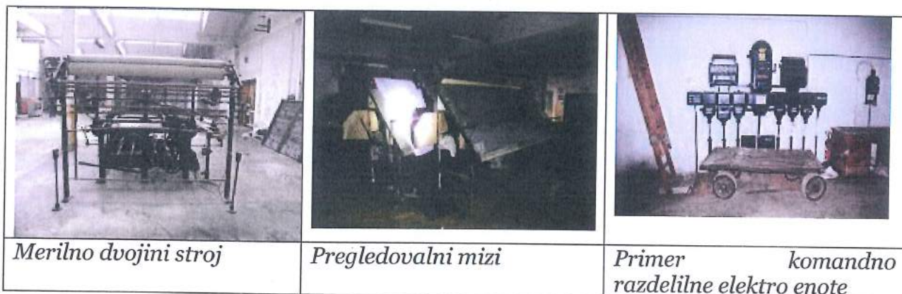
Merilno dvojini stroj