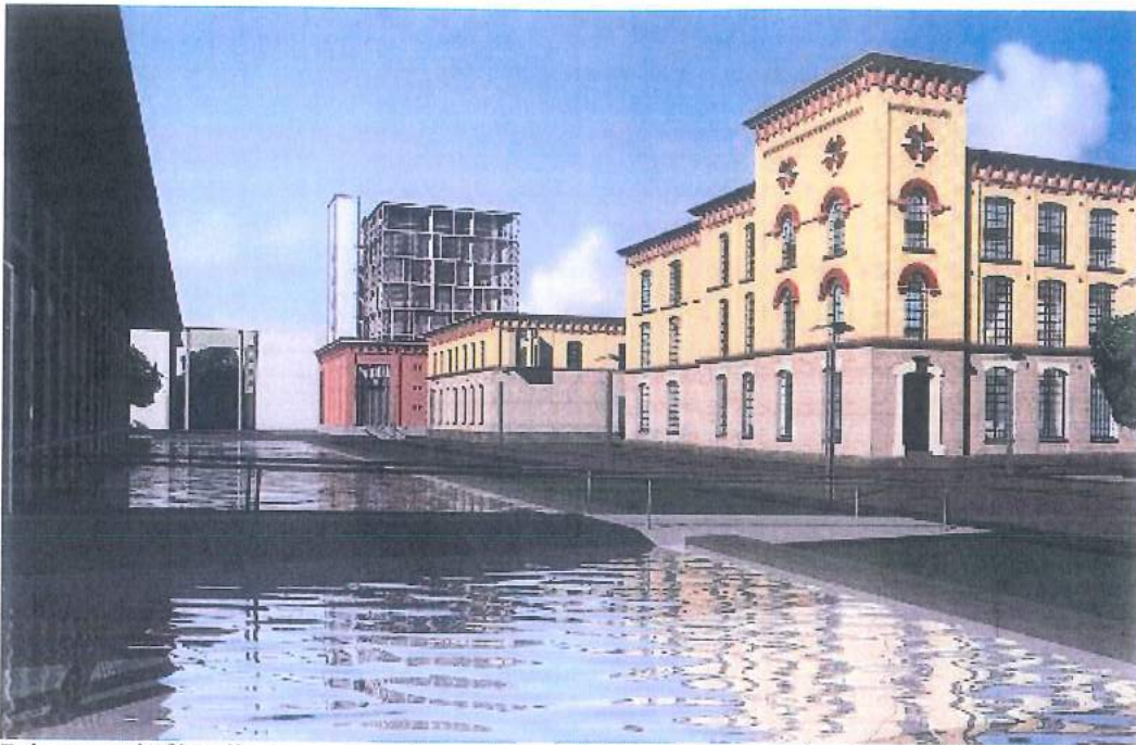
Primer revitalizacije oz. prenove kompleksa tekstilne tovarne v Stuttgartu, Nemčija (Moderno urejen in oblikovan historični urbanizem)