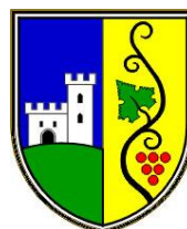
OBČINA PODLEHNIK Podlehnik 9 2286 Podlehnik