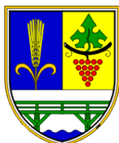
OBČINA VIDEM Videm pri Ptujju 54 2284 Videm pri Ptujju