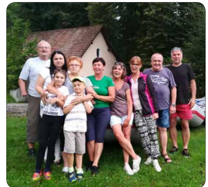
Tri generacije članov Združenja 91 pred podvigom.

Predstavniki združenja smo septembra v okviru programa Sveta invalidov Mestne občine Maribor, ob evropskem tednu mobilnosti, pripravili »Kolesarski pohod« za vse skupine invalidov z našega konca. Pohod je sledil motu letošnjega tedna mobilnosti »Združuj in učinkovito potuj!«, naš pohod pa smo naslovlili »Sprehod ob Dravi, s pogledi na mostove, takšne in drugačne.« Na sprehodu, ki se ga je udeležilo čez 60 pohodnikov, smo predstavili zgodovino mariborskih mostov čez reko Dravo. Ker nismo premagali celotne poti, ki je dolga 4,2 km in spoznali vseh mostov, smo sklenili, da pot nadaljujemo ob drugi priložnosti.