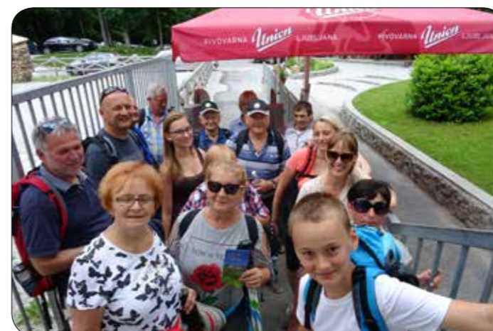
Ni bilo prav poceni, pa še čakati smo morali!

bogato vsebino, naš sprehod po njegovem središču pa smo končali v frančiškanskem samostanu Sv. Jakoba, kjer smo si ogledali zadnjo Plečnikovo stvaritev – Kapelo božjega groba, ki je urejena v zanj značilnem slogu in je bila dokončana leto pred njegovo smrtjo.