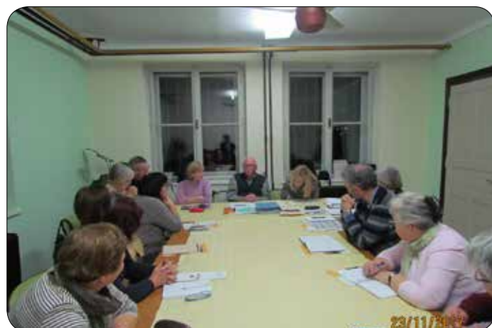
Šola zdravega življenja

Ena od oblik izobraževanja so učne delavnice s skupnim naslovom »Štirje koraki za izboljšanje sladkorne bolezni«. Delavnice v društvu pripravljamo že tretje leto in vsak prvi torek v mesecu se dobimo v predavalnici na sedežu društva. Pred pričetkom izvedemo meritve sladkorja v krvi, predstavimo merilnike sladkorja in kako jih pravilno uporabljamo. Sledijo