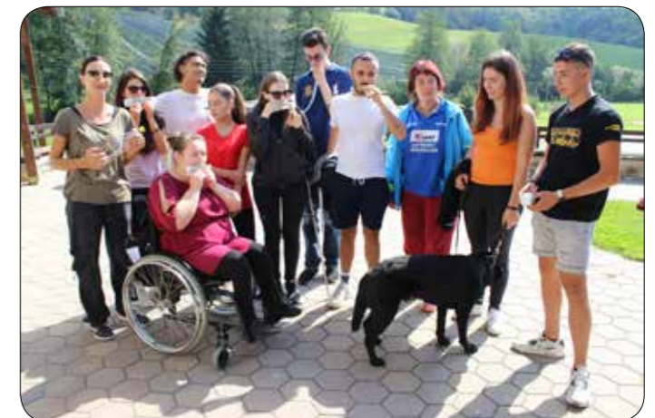
Nastop z glasbili, ki so jih sami izdelali

Imamo se zelo lepo, saj preko aktivnosti, ki potekajo, izmenjujemo različne izkušnje in mnenja. Ne primanjkuje nam niti sonca in dobre volje.