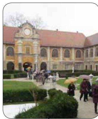
Izlet - Grad Štatenberg

Že vrsto let v program dela zapišemo tudi druženje. Tako smo si v marcu ogledali dvorec Štatenberg pri Makolah, aprila organizirali rekreativni piknik s pohodom, namiznim tenisom, ruskim kegljanjem in pikadom na Domu Jelka Pohorje, maja smo se udeležili športno rekreativnega srečanja diabetikov Slovenije v Dolenjskih toplicah, si ogledali izvir Krke, junija smo bili na Rogli in odšli na pohod do Lovrenških jezer, septembra izlet Trije kralji na Pohorju, oktobra kostanjev piknik, novembra izlet z martinovanjem in v decembru prednovolentno druženje ob glasbi v živo.