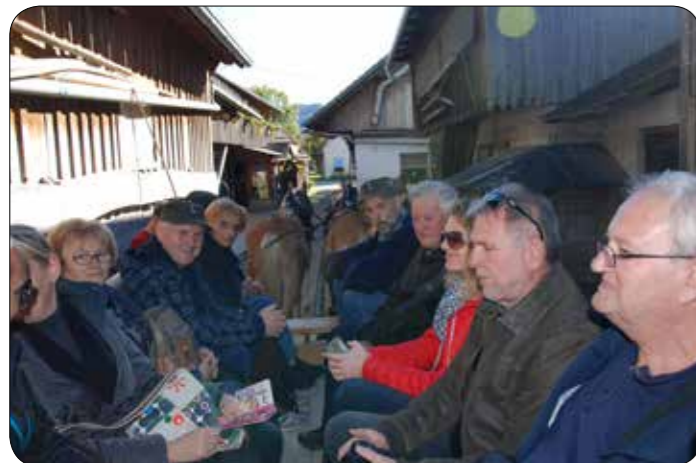
Pred vzletom »lojtrnika« ob Cerknškem jezeru.

Lanskega oktobra smo izvedli izlet na Notranjsko. V Ljubljani in si ogledali zbirko Muzeja VSO, nadaljevali z ogledom Tehničnega muzeja Slovenije v Bistri, obiskali pomnik tragično umrlima teritorialcema na Cesarskem vrhu nad Vrhniko, spominsko obeležje TO v Logatcu, Muzej Cerknškega jezera in zaključili s »panoramsko« vožnjo z lojtrnikom.