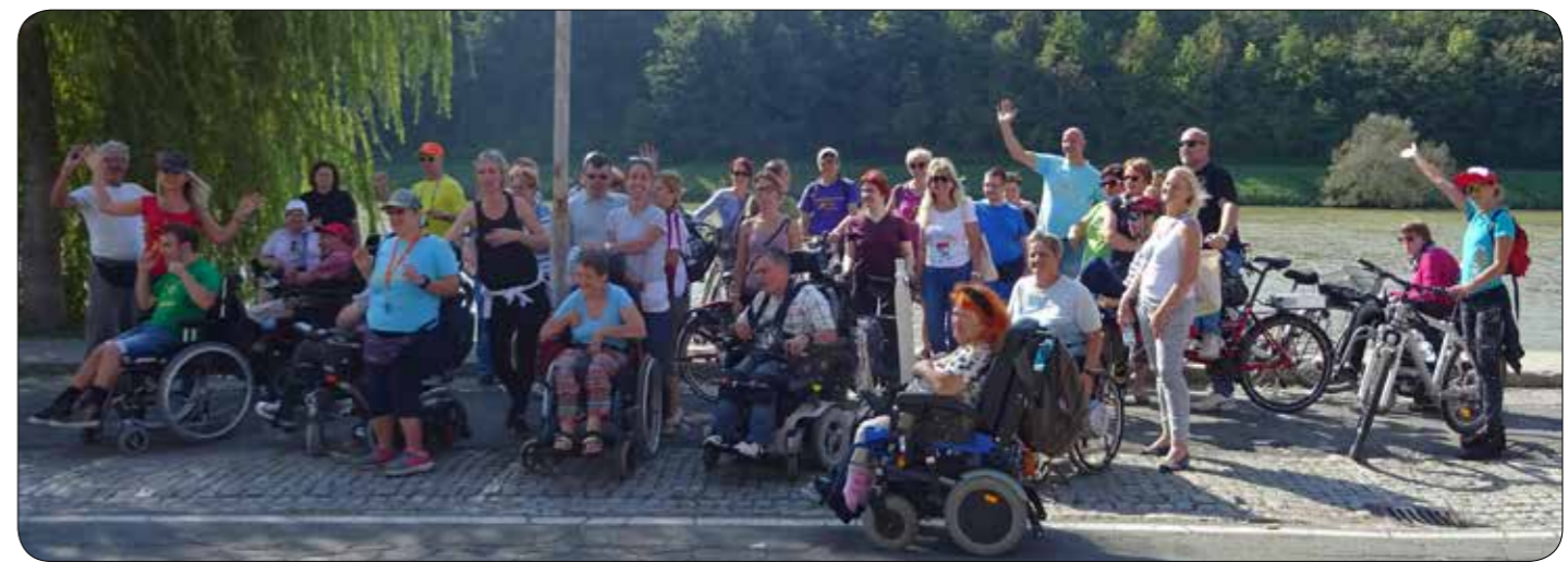
Ni bilo prav poceni, pa še čakati smo morali!

Stalnica spoznavanja mest, ki jih na izletih obiskujemo, so vodeni ogledi po starih mestnih jedrih. Kamnik je mesto z