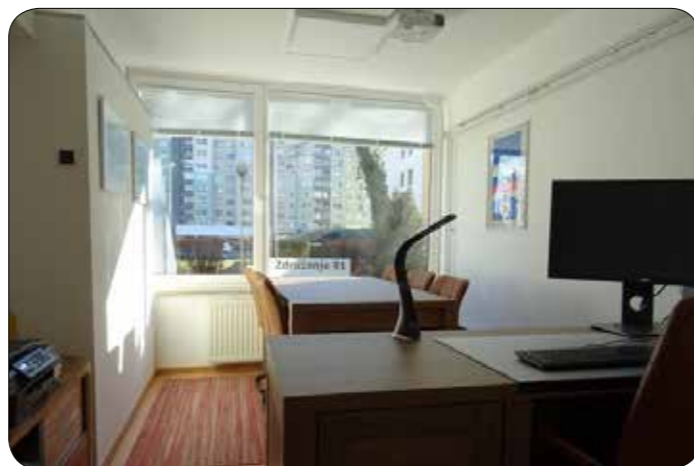
Pisarna Združenja 91 na Kardeljevi 60 v Mariboru.