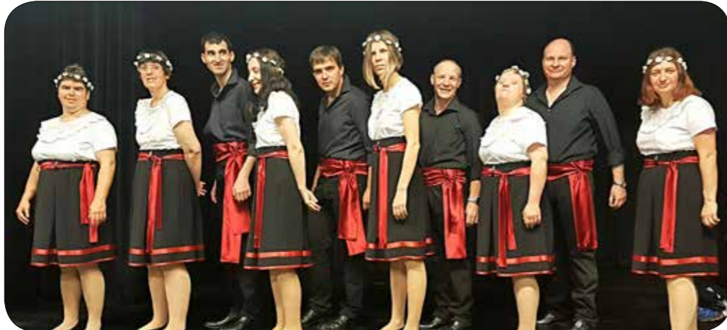
Nastop plesne skupine VDC Sožitje Maribor na reviji Zapijmo, zaigramo, zaplešimo v Velenju