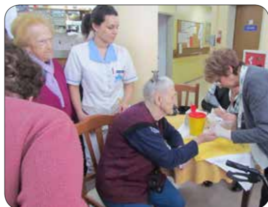
Meritve sladkorja v krvi Dom D.Vogrincec-Tabor

Preventivnim programom za preprečevanje sladkorne bolezni dajemo v Društvu diabetikov Maribor največjo pozornost in v sklopu teh aktivnosti so tudi meritve krvnega sladkorja. Brezplačno smo izmerili krvni sladkor več kot 1500 občanom. Društvo je izvajalo aktivnosti na različnih krajih. Radi pridejo tudi v delovne organizacije