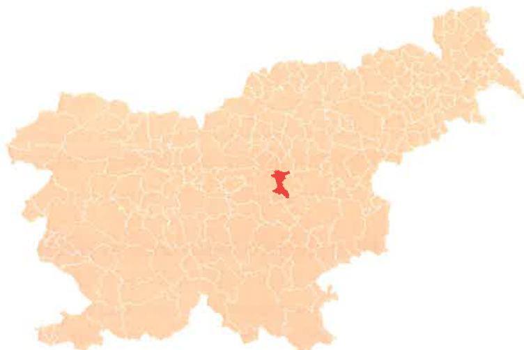
Slika 1: Občina Trbovlje

Občina Trbovlje se nahaja znotraj zasavske statistične regije, najmanjše regije v Sloveniji. Po površini občina meri 58 km 2 in se s tem uvršča na 122. mesto v Sloveniji. Sredi leta 2018 je imela 16.014 prebivalcev, pri čemer število predstavnic ženskega spola za malenkost izstopa in sicer je teh približno 8.210, moških pa 7.830. Po številu prebivalcev se uvršča na 32. mesto. Na kvadratnem kilometru površine občine je v letu 2018 živelo povprečno 277 prebivalcev. Gostota naseljenosti je torej tu večja kot v celotni državi, ki je 102 prebivalcev na km 2 (SURS, 2020).