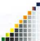
Stroški dela - izpis iz bruto bilance