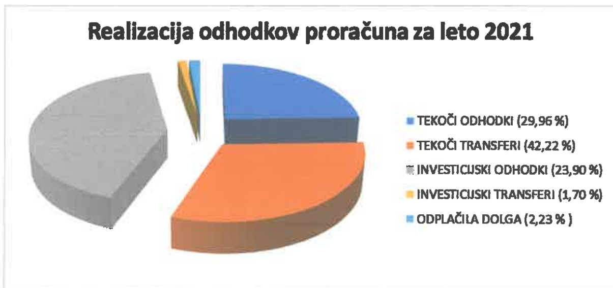
Graf 2: Realizacija odhodkov proračuna v letu 2021