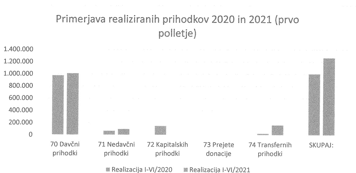
Slika 1: Primerjava realiziranih prihodkov prvega polletja za leti 2020 in 2021

V sliki 1 je prikazana primerjava realiziranih prihodkov prvega polletja za leti 2020 in 2021.