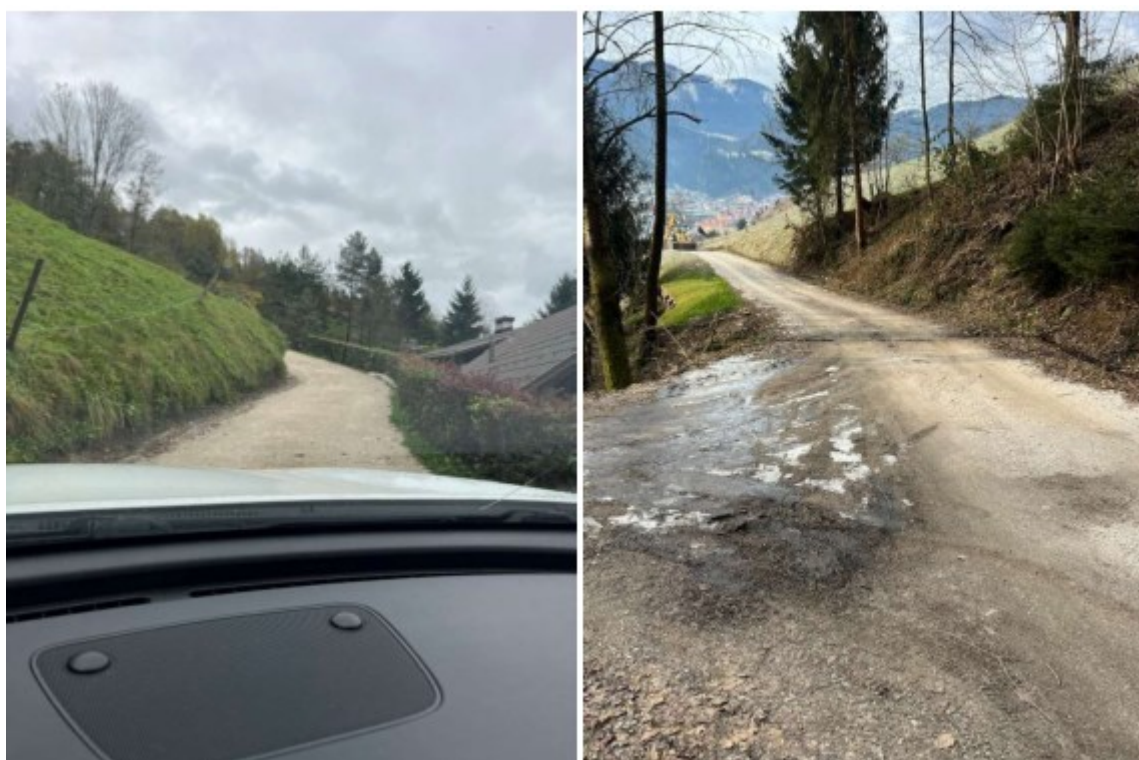
Slika 4: Fotografiji na območju stabilizacije