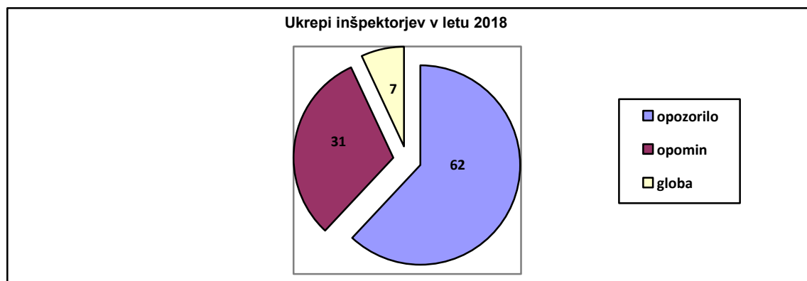
Grafikon 2: Izrečeni ukrepi inšpekcije, v prekrškovnih postopkih, v letu 2018