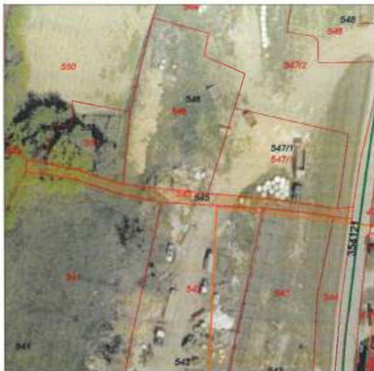
PARCELA 35 545